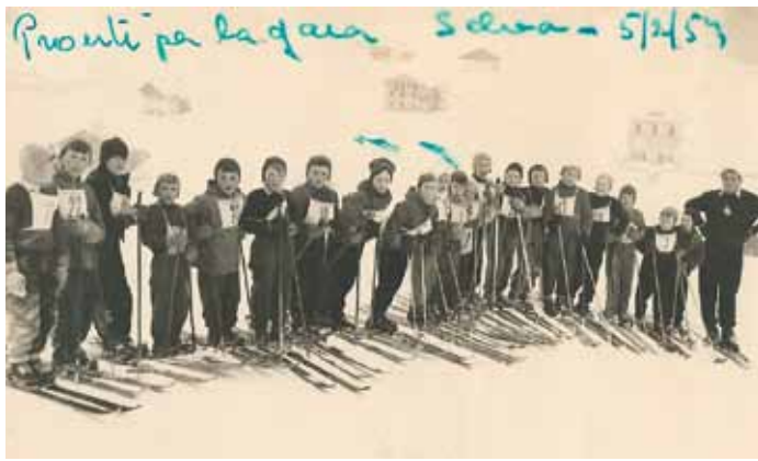
"Pronti per la gara" - Prima garajeda di sculeies via Frëina (fauré dl 1954)