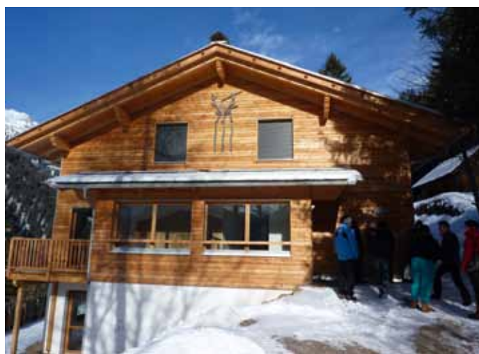
L' "Jugendhaus Hahnebaum" tla val de Passeier. Model per l' Miramonti?

La rejon fova chësta: da truep ani inca veniel pensà cie fe cun l' hotel Miramonti sun Plan de Gralba, che ie aldidancuei avèi dl' Chemun. N iede oven l'idea de fé dainora na "Jugendherberge" y perchël ova l'aministrazion chemunela da dant nce bele lascià fé n proiet. Sèn iesen plucheauter dla minonga de valuté sce n pudèssa realisé na cèsa automanejeda "Selbstversorgungshaus". Na tel struttura fossa scialdi mèn dra de chëla ududa dant tl' prim proiet y ti unissa ncontra dantaldut al bujèn di jèu-