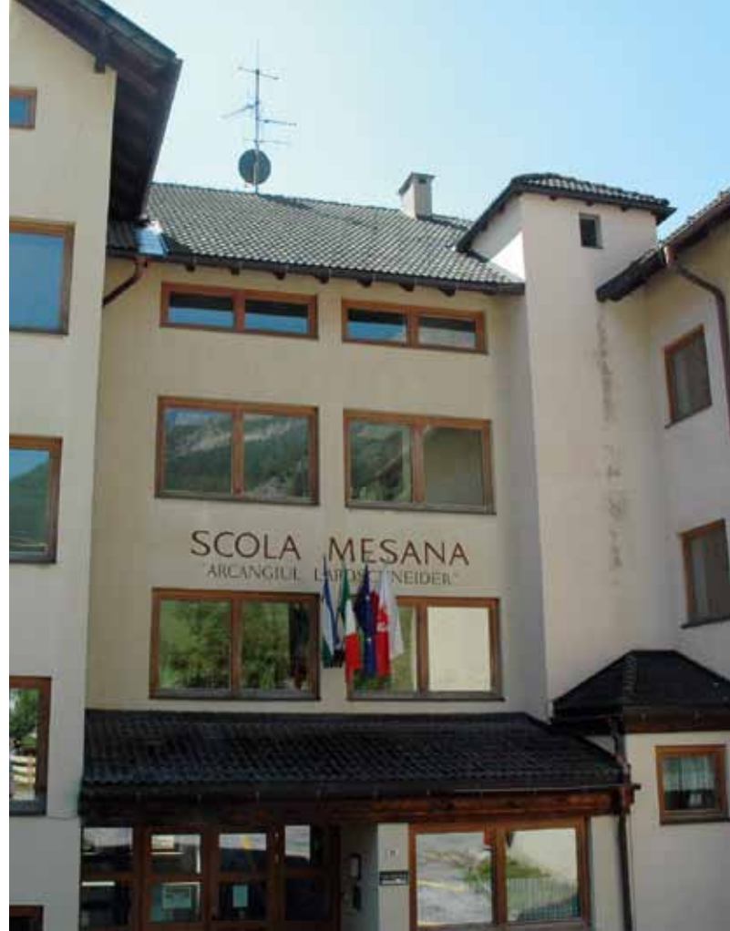
Derzeit läuft eine EU-weite Ausschreibung der Bauleitung für den Neubau der Mittelschule Wolkenstein.

Am 11.02.2013 erfolgte die Vertragsunterzeichnung zwischen der Gemeinde und der Bietergemeinschaft, sodass die notwendigen Arbeiten im Kulturhaus Mitte März 2013 beginnen und bis Ende Mai 2013 abgeschlossen sein werden. Im Zuge dieser Arbeiten wird auch die Post verlegt (Galario Bera Albino). Es ist dem ausdauernden Engagement des Bürgermeisters zu verdanken, dass die Post, trotz der notwendigen Sparmaßnahmen, am Standort in Wolkenstein festhält und einer Verlegung samt Neueinrichtung zugestimmt hat. Hingegen betreffend des geplanten Neubaus der Mittelschule mit den Spezialeinheiten für Musik läuft derzeit die EU-weite Ausschreibung der Bauleitung . Innerhalb Ende März 2013 gehen die Angebote ein, sodass Ende Mai 2013 die Bauleitung beauftragt werden wird.