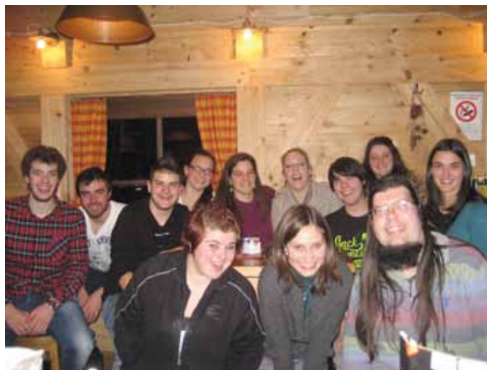
L' Cunsèi di "Jèuni Sëlva" deberieda a cèina

Scumencià an cun la prejentazion dl'ativiteies metudes a jì via per l'ann 2012, danterauter la festa de Sacro Cuer Gejù, la benedescion dl' Crist nuef de Piz Miara y la jita tl' Ötztal tla „area 47“. Daldò à la autoriteies tèut la parola fajan vel pruposta per ativiteies tl' proscimo