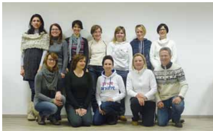
L cunsèi nuef dl VKE Gherdèina

Cun la prima senteda dl cunsèi nuef ie pona nce unides spartides su la ncèries. Per l lèur da presidènt