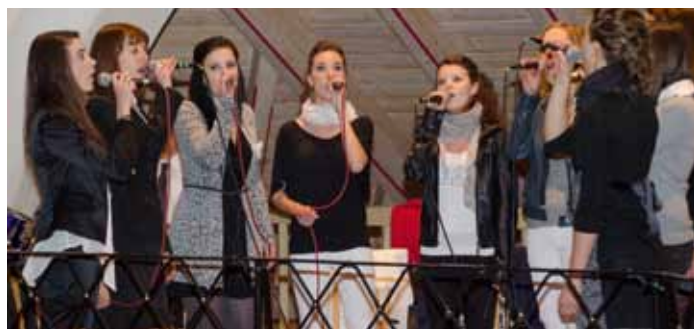
I Hosianna ntan na mèsca da noza

Per l ann 2013 iel inò n valguna santa mèses y nozes sun l program. Per l instà (de lugio) ulèssen mèter a ji deplu cunzerc. Do la senteda iesen pona jic a cèina ulache la sèira à metù man cun n boniscimo menu y jita a finè cun devertimènt y mujiga, cianteda y suneda mpue da duc canc.