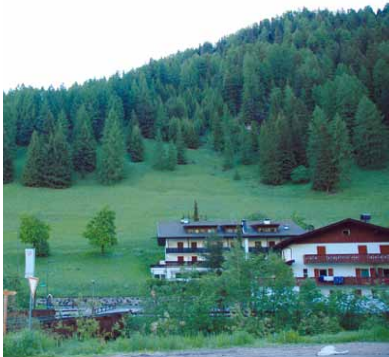
La Provincia di Bolzano ha concesso un consistente contributo per la bonifica della zona "Pralong" riguardante interventi di protezione da caduta massi.

RIFIUTI: Sono state approvate e vincolate in bilancio le spese presunte per il servizio di raccolta di smaltimento dei rifiuti solidi urbani e precisamente: