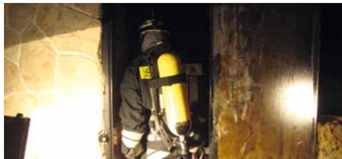
Bei einem Einsatz ist es von großer Wichtigkeit sich schnell ein Bild des Brandgeschosses zu machen.

Zum Erlangen der Baukonzession wird viel Geld in Not- und Evakuierungspläne investiert. Diese liegen aber später dann meist vergessen in einer Schublade. Der HGV von Wolkenstein und die Feuerwehr Wolkenstein bitten diese Pläne (oder zumindest jene, welche die brandgefährlichsten Geschosse wie Sauna,