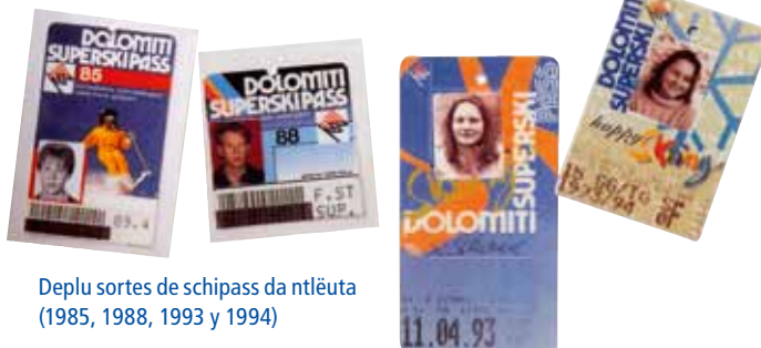
Deplu sortes de schipass da ntlèuta (1985, 1988, 1993 y 1994)

Dut. Franz Perathoner: "Vester boni de fé nëif artificzialmènter fova de mpurtanza essenziela per nëus. Metù man fovel uni ti ani 1980. Tan de sajons fossa pa jites ala nia o jites a finé melamènter, chël ne pudons niancano se nmaginé. Ncucicundi ons la garanzia de avèi na sajon che va dal scumenciamènt de dezèmber nchin Pasca. Chël ne fova pludagiut nia.