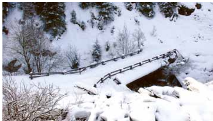
Sono stati approvati i progetti esecutivi per il risanamento dei ponti "Cristl" e "Julian" in località Dorives

Sono stati approvati il certificato di regolare esecuzione e il rendiconto finale dei lavori di costruzione di una fognatura a "Plan da Tieja" per un costo complessivo di 113.534 euro, delle opere murarie inerenti il centro culturale "Tublà da Nives" - 1. lotto per un costo complessivo di 612.793 euro e di costruzione del centro di riciclaggio „La Poza" per un costo complessivo di 314.690 euro.