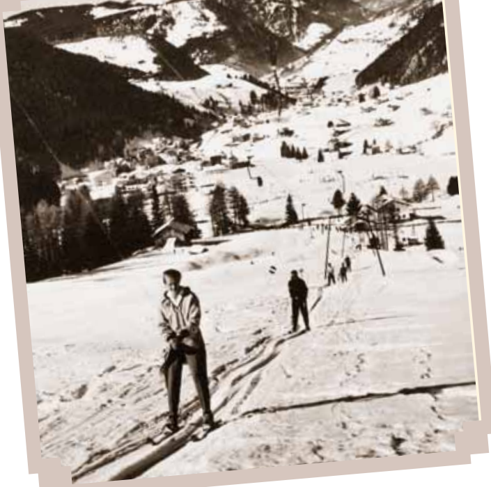
L lift de Risaccia tl ann 1962.

Dut. Franz Perathoner: „Ie rate che ne dausson nia sèuravalutè la funzion de Dolomiti Superski. Sce rejone per Sëlva y Gherdëina iel da di che nosta valeda se ova fat n boniscimo inuem cun i „Mondiali“ dl 1970. D’autri luesc che ne n’ova