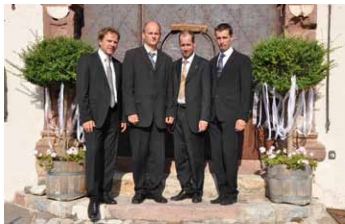
L Ensemble Ploner abelirà l "Wiener Abend" cun mujiga carateristica de chèi tèmps

Strauß, Lehar, Suppé, purteda dant dala priejeda grupa de Gherdëina Ensemble Ploner. Danter ite deplù relaziions curtes per spieghè y capì l spirt dla sozietà vieneja asburgica dl '900. L musizist Eduard Demetz rujenerà sun la mujiga carateristica dla Viena de chèi tèmps, l diretèur dla sco-