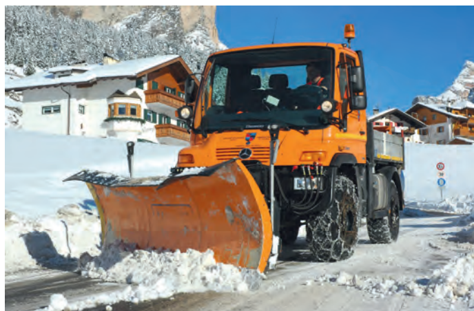
La cudries y i autri njins de Chemun giaperà l' GPS

N'otra cusion, plu atuela y zitia, che ie stata la rejon de cumpré chësc sistem de rilevazion, ie chëla dla responsabèlta y dla ngrum de plures che l' chemun giapa uni ann, for plu y plu, n' cont de danns per manutenzions nia a puntin. Suvènz se tratel de persones che ie sbri-scèdes y tumedes sun tretuars o stredes mpue lizies y che ti dà la gauja al Chemun che ne n' à nia palà sci che l' se toca. Tres l' GPS puderan damoinla mustré sù avisa can y cie che ie unì fat schivan povester una o l' altra plura.