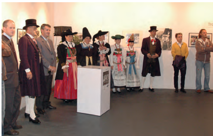
Pra la giarida dla mostra "La troht, l guant da Sandi"