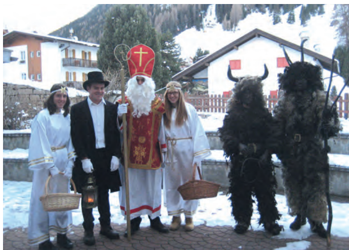
San Miculau cun l fant, doi angiuli y doi malans

N juebia, ai 5 de dezèmber iel inò uni metù a jì l tradi-ziunel San Miculau. N chësta sèira se à abinà bèn 4 grupes per jì da cësa a cësa a cri i pitli mutons, che uni ann aspjeta bele drèt ert sun chësta ntraunida. San Miculau, si fant y i doi angiuli se à scialdi purvâ acioche i pitli