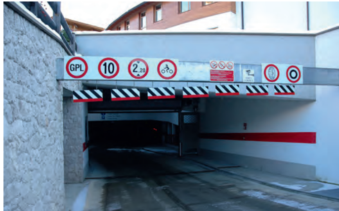
L'entreda tl garasc Nives: la prima ëura ne paien nia.

rasc Nives à plutosc stënta de tlienc. Y sce n pënna che l'ie na struttura bele amesa l luech pona se fejen bën marueia che la vën nuzada do la rata puech. Per sensibilisé mo deplu la jënt a parché te chësc garasc sotatiera à la Pranives Srl deberieda cun l'aministrazion