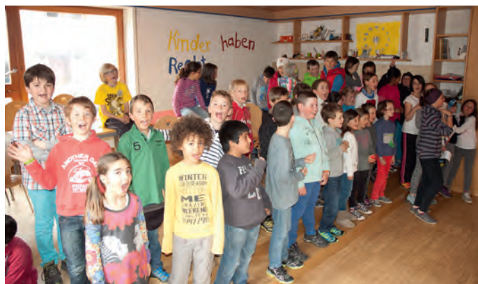
Während den Proben im Jungscharraum

■ Wenn sich Stofftiere wie Bären und Gorillas, Detektive und Puppen weltweit auf die Suche nach einem Schlüssel begeben, dann kann nur etwas ganz Großes dahinter stecken. Dann kann es nur ein Abenteuer sein, das von Freundschaft und Toleranz erzählt, das Spielzeuge verschiedenster Art verbindet und eigentlich eine ganz bestimmte Botschaft vermitteln soll. Welche, das weiß zu Beginn der Reise noch niemand. Die Schüler der 3. und 5. Klassen der Grundschule Wolkenstein haben ein besonderes Projekt auf die Beine gestellt, das sich nach einer mehrmonatigen, intensiven Arbeit nun dem Höhepunkt nähert.