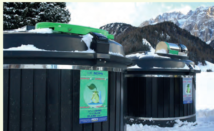
La ijules ecologiches tla streda Col da Lech vën nuzedes truep.

De duc chisc problems iel uni rujenà nstadi cun la mpreja specialiseda che va a tò l refudam. L'aministrazion de chemun se à damandà che per la proscima