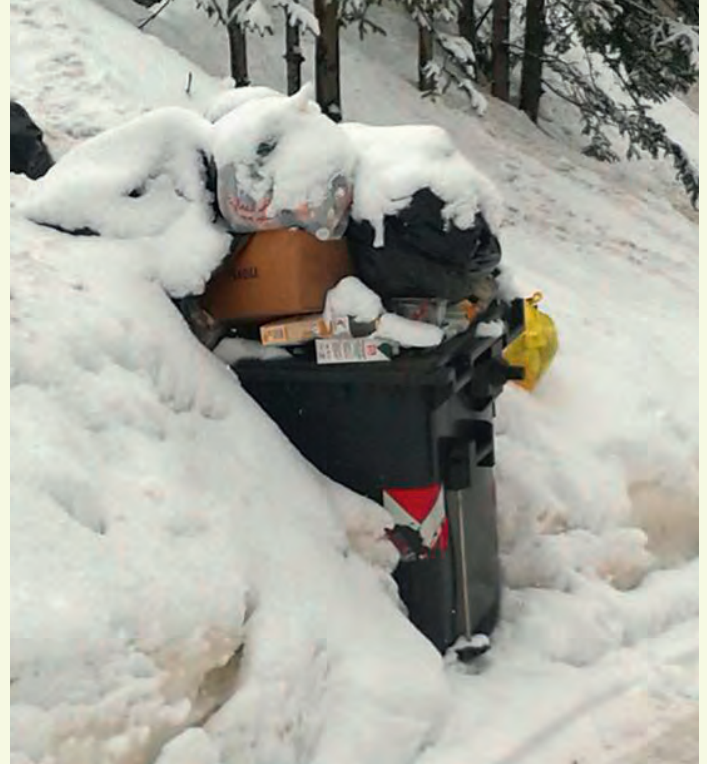
Chibli nevèc ite ne n'ie nia sauri da spusté...

sajon da d'inviern vëniel metú personal assé y magari vel camion sëuraprò. l respunsabli dla firma TPA à desmustrà si despunibltà de miuré l servisc y de cuntenté tl dauni duc i zitadins.