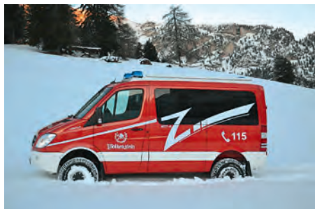
L Mercedes Sprinter 4x4 nuef

N dumënia ai 4 de mei iel San Flurian , patron di destudafuech. Nce la grupa de Sëlva festejea si Sant Patron cun na santa mëssa che vën lieta l di dant, n sada ai 3 de mei dala 6 da sëira. Do mëssa unirà benedi l auto nuef, n Mercedes Sprinter 4x4