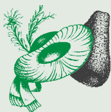
Lia Cultura y Usanzas Sëlva

Chèst ann d'autonn uniràl festejè i 50 ani dla lia. L ideal da ntlèuta va inant nce al didancuei y plu avisa chèl de teni su y valorisé mo de plu nosc bieì guanc dala gherdèina. L program dla festa plu avisa unirà mo fat al savèi.