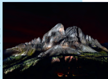
Sas de Pütia