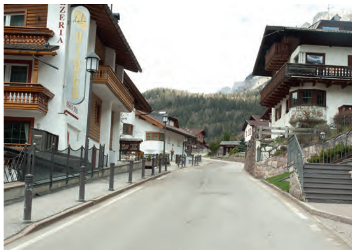
Nella strada Dantercèpies sono previsti diversi lavori

Sono stati approvati i verbali della Commissione giudicatrice per la formazione di una graduatoria pubblica per l'assunzione di vigili urbani a tempo determinato. Quindi è stato assunto per 1 anno il vincitore della sele-