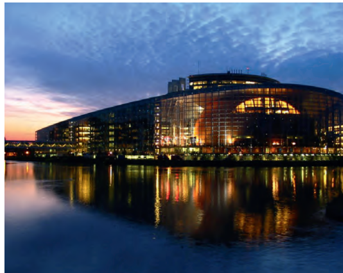
Der Sitz des Europäischen Parlamentes in Straßburg

L ie bele ngrum de ani che l Chemun de Sëlva mèt a jì la scumenciadiva de jì a rumé su l luech, scumenciadiva pra chëla che l fej pea daniëura trüep zitadins y dantaldut nce sculeies. Che i sculeies juda pea vèn nce valutà sciche at de sensibilisazion. Per fé a na maniera che nce i sculeies posse judé à l'aministrazion de chemun, deberieda cun la direzion dla scola, pensà de mèter a jì l'azion n merdi ai 27 de mei 2014 dala 14:15. N se anconterà dan la Cèsa de Cultura "Oswald von Wolkenstein". L'aministrazion cumenela de Sëlva ti sènt bele sèn gra de cuer a duc chëi che cunlaurerà y che se mèt a despozision a rumé su nosta Sëlva!