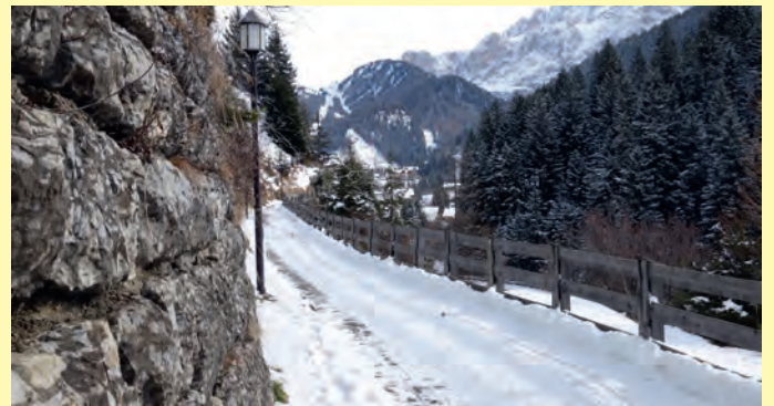
La passeggiata molto frequentata verrà risanata ed allargata.

Quindi è anche stato approvato il progetto esecutivo che prevede una spesa complessiva di Euro 539.134, di cui Euro 401.739 per lavori e Euro 137.394 a disposizione dell'amministrazione. Infine è stata avviata la procedura d'appalto dalla quale è risultata aggiudicataria l'associazione temporanea (ATI) Gögele S.r.l. - Erdbau S.r.l. con un ribasso del 30,58%. L'aggiudicazione è provvisoria in attesa dell'esito delle verifiche sull'anomalia e sulla congruità dei prezzi.