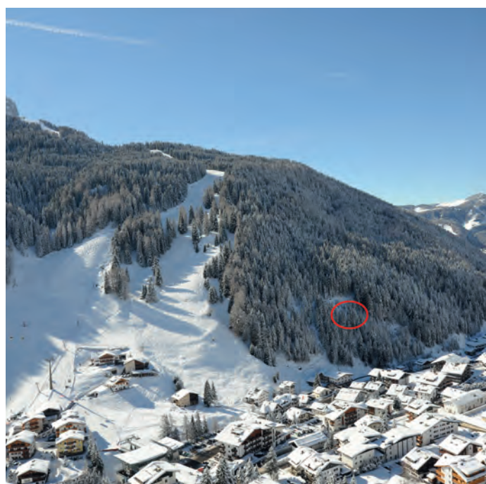
La giunta comunale ha incaricato lo Studio Tirolprojekt con diversi lavori riguardanti la realizzazione di un nuovo traliccio per telecomunicazione in località Sëurafrëina.