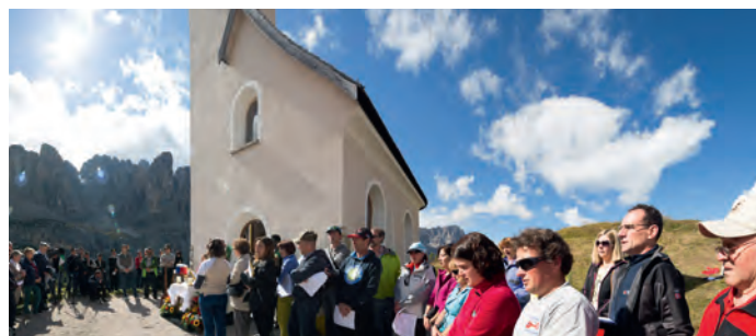
Ciantarins de Sëlva n ucajian dl anivërsar di 10 ani dla capela sun Frea

ciantarins y ciantarines naves; dantaldut pra l tenor iel ciarestia de ujes. Sce a zachei ti savëssel bel a cianté pea iel prià bel de nes cunataté. Purmepò sons na bela cumpëida de 37 persones danter l dirighënt, l'ugrista, duta la ciantarines y i ciantarins, y i cater musicontri che acumpania te cërta ucajions regularmënter l cor cun i strumënc a fla. Acioche la ti vede bona a n cor tl tëm, iel debujën de persones che se dà ju cun