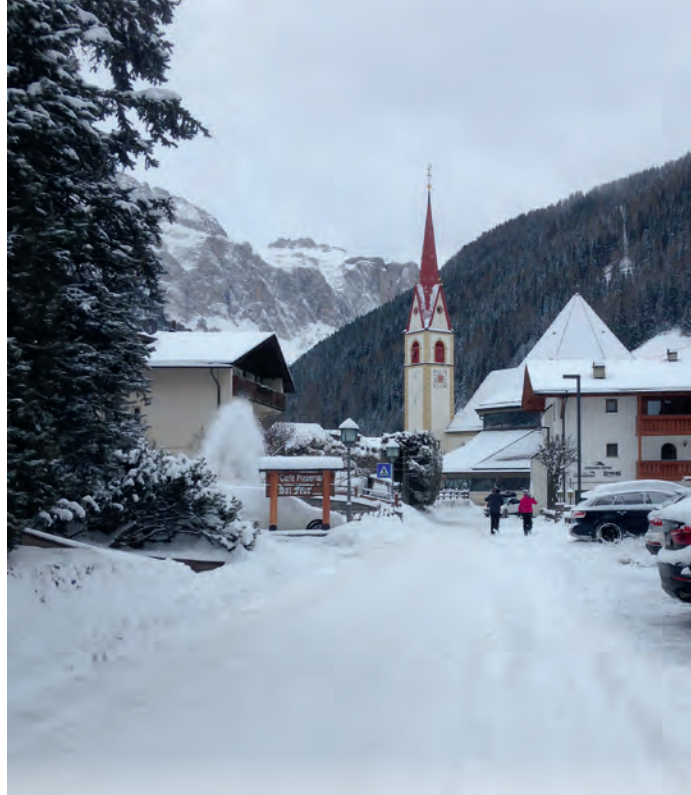
La streda Puez bela bianca... danz che l luech fej plu paruda!

L sel desfej tres na reazion chimica i cristai che ie tla nëif y tres chësc fenomen