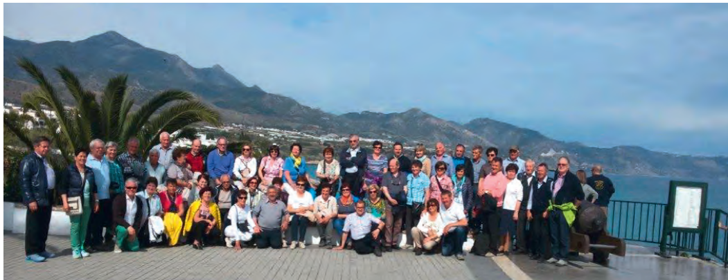
L KVV de Sëlva à fat l ann passà n viac tla Andalusia (Spania).