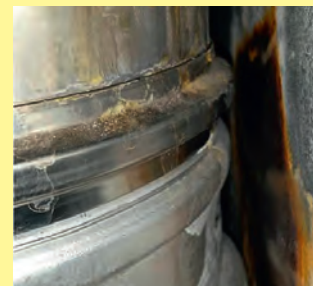
Defektes Rauchrohr, die Abgase entweichen!