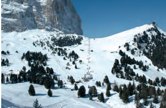
La giunta comunale ha avviato l'iter di approvazione di una modifica del piano urbanistico comunale riguardante l'ampliamento di baite di montagna già esistenti.

• Gara per lo spurgo e l'ispezione delle fognature comunali 2016 - 2018 - esito della gara informale e aggiudicazione definitiva