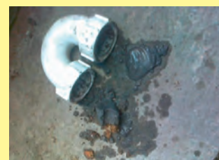
Der Syfon der Kondensleitung einer Brennwertanlage muss regelmäßig gereinigt werden.