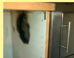
Bei Feuerstätten muss bei der Installation auf den Mindestabstand zu brennbaren Teilen geachtet werden.