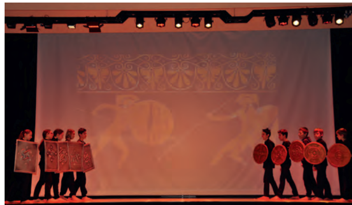
Eine Szene aus dem Stück "Parlando, parlando"

Nach einer musikalischen Einleitung begrüßten drei Schüler die anwesenden Gäste, Eltern, Großeltern und Verwandte aus nah und fern, die Schüler und Schülerinnen der 1. und 2. Klassen, die Professoren und alle Mitarbeiter der Mittelschule.