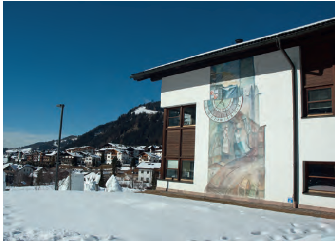
Il consiglio comunale ha deliberato nella sua ultima seduta dell'anno il bilancio di previsione che si aggira - fra entrate e spese - ai 15 milioni di euro.

Il consiglio comunale è stato convocato per il 30 dicembre per deliberare il bilancio di previsione 2016 e alcuni documenti tecnici connessi. Si è dovuto attendere l'ultimo giorno utile al fine di avere i presupposti e le informazioni minimi per predisporre un documento tecnico che consenta almeno la gestione per i primi mesi dell'anno. Ciò è dovuto al ritardo con cui è stata avviata la riforma per l'armonizzazione dei bilanci alla struttura europea. A parte problemi tecnici e informatici, la stessa legge provinciale che regola la nuova contabilità è stata