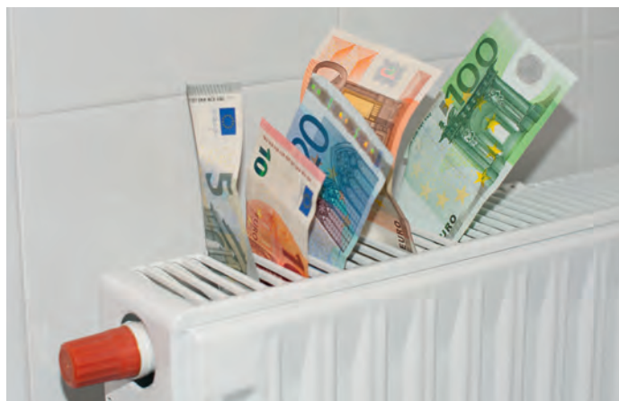
Es gibt viele Tricks, wie man Energie im Haushalt sparen kann...

An diesem Informationsabend werden die TeilnehmerInnen informiert, wie durch einfache Maßnahmen beachtliche Energieeinsparungen erzielt und die Haushaltskosten wesentlich gesenkt werden können. Dadurch sparen die Haushalte nicht nur Kosten, sondern leisten auch einen Beitrag zur Verringerung der Treibhausgasemissionen und tragen so auch zum Schutz unserer Umwelt bei. Im Rahmen der Veranstaltung werden Themen wie Energieverbrauch