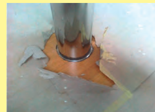
Beispiel einer Neuinstallation. An diesem Kamin ist ein Kachelofen angeschlossen. Der Holzboden ist in direktem Kontakt zum Edelstahlkamin. Der Mindestabstand zu brennbaren Bauteilen wurde nicht eingehalten.