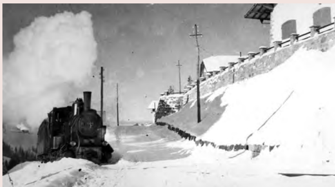
La ferata passova via te ot luesc la streda sciche tlo sota Rustlea.

Scutan su la testimonianzes univel cuntà truep de chisc chisc puere rusc, che univa a se petlé pra i paures mpue de lat, vel'patat o ref, ma nce che n messova cialé dassēnn sun si ciamps aja-