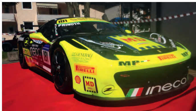
La Ferrari 458 de Erich Prinoth cun chëla che l à venciù dl 2015 la Coppa Shell.

Gherdëina ie na valeda ulache l sport à na gran tradiçion ma ulache l vën nce arjont uni ann de bon resultat y chëi mpue te d'uni sort de disciplines. Nsci se à bele da n valgun ani i chemuns de Gherdëina y de Ciastel metù adum per urganisé na festa dl sport, na festa ulache l vën premià y sèurandat uneranzas a persones che se à fat unëur y che à nce teni aut l inuem de nosc luech y de nosta valeda.