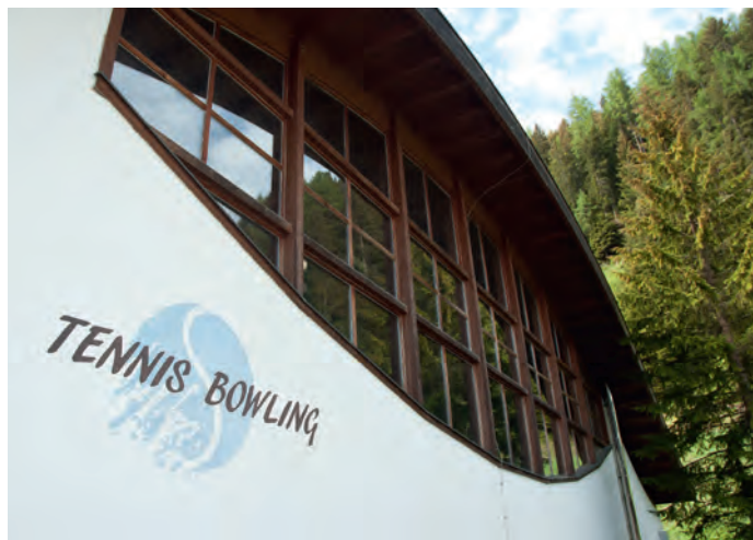
È stato aumentato il capitale riguardanti la Società per attrezzature sportive Selva

È stato approvato il rendiconto della gestione per l'esercizio finanziario 2015 . Sulla scorta della relazione sottoposta dalla Giunta comunale e del parere del revisore dei conti, il Consiglio