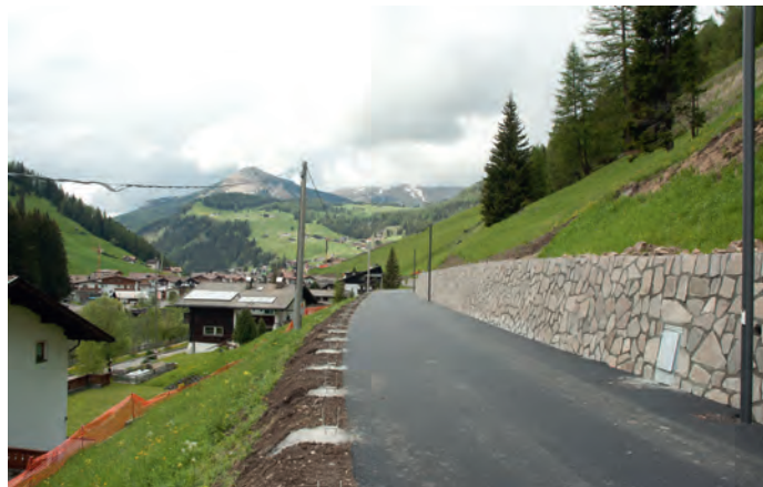
Pra I troi dla rodes da Plan ora mancel mo la sief, la iluminazion y pona la risses.

La plaza dai juesc tl raion "Maciaconi" fova propi melciafieda cun juesc roc y njins desfac. Nsci à l'amministrazion de chemun tët la dezijion dla mèter inò al ordn; per mez lugio sarà la