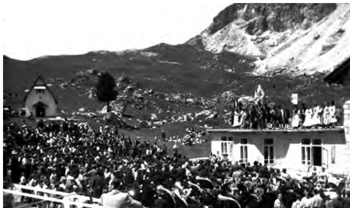
Sun jëuf de Sela, luglio 1946: dan 70 ani se damandova plu de 3.000 ladins de duta la valedes l recunescimènt ufiziel de si grup etnich.