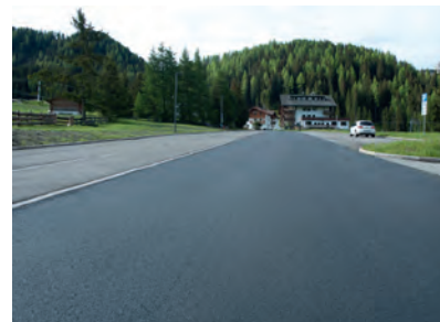
La streda danter I hotel Alaska y Pinzigher cun I bel asfalt nuef.

plaza inò anjenieda cun juesc nueves per deverti pitli y nce i granc.