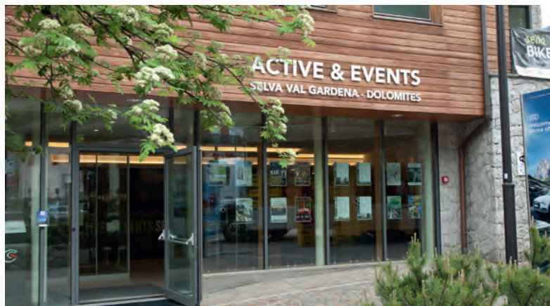
L'ufficio per manifestazioni dell'Associazione Turistica Selva Gardena presso l'edificio multifunzionale "Karl Unterkircher"

È stata approvata la deliberazione di modifica del contratto per la costituzione del diritto di superficie e di servitù di passaggio a