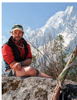
Karl Unterkircher, scomparso nel 2008 sul Nanga Parbat

Quale evento biennale si rivolge agli alpinisti che nel corso del 2014 e 2015 hanno dimostrato particolari abilità alpinistiche o hanno preso parte a spedizioni in stile alpino di grande valore. Verranno selezionati 3 alpinisti o gruppi di alpinisti da tutta Europa.