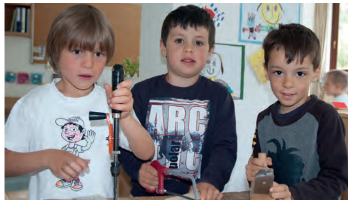
Mpurtant per l svilup ie che i pitli se feje sperienzes d'uni sort te scolina.