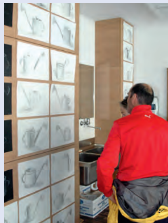
Do la pert ufiziela pudova duc i nteressei jì tres scola y ti dé na udleda ala tlasses.