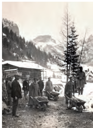
Na curiëusità: dan avisa 100 ani univel ènghe giavà tla raida da Larjac, sun I troi dla ferata.

L vën laurà dassënn sun I troi dla ferata tla raida da Larjac ulache n ie tl lèur de ressané y slargé I troi. L se trata de n lèur plutosc ncomper da fé y che va inant perchël mé bel plan. Bonamënter ne fineràn nia via cun i lèures per la fin de juni y n sarà nscila sfurzei a jì inant d'autonn cun chisc lèures davia che la prome-meda dëssa vester davierta ntan i mënc da d'instà.