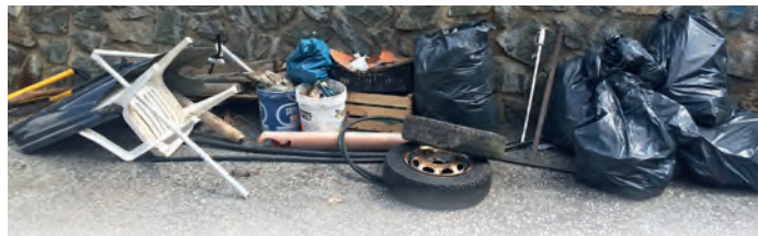
Refudam d'unì sort iel unì abinà adum, dantaldut dl'ongia la stredes che mèina sun i jèufs

tala capela de Val, n'otra da La Sèlva nchin tl zènter dl luech y una da Plan ite. D'autri ulenteres ie nce unì menei sun l jèuf de Sela, sun Frea y sun Plan de Gralba, da ulache i univa pona ju de viers de Sèlva tlupan su d'unì sort de maroca y respuc che i abinova. L ne n'ie belau nia da se nmaginé ciche la jènt smaca tan ncantèur. N pudèssa bèn miné che al didancuei iel de viers dl ambient y dla natura na gran sensibiltà, purmempò n iel