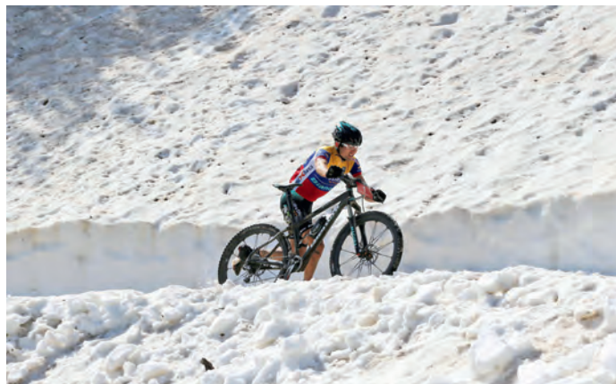
Auch das ist HERO. Radfahren im Schnee...

Das Festival beginnt am 16. Juni mit einer geführten Tour auf den HERO Trails, die sich sowohl für Anfänger als auch für echte Könnere eignen. Am Abend fin-