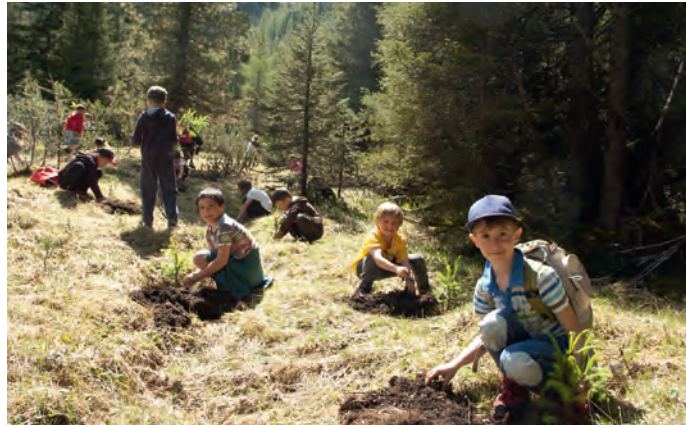
Uni sculé à pudù senté ora n si pitl lën

Viulënza sessuela possa dantaldut uni dant tl cêrtl dla familia o de cunescënc, ma nce te d'autri ambienc (per ejèmpl te scola o tl tēmp liede) y suvënz ie i autores cunescënc o gor mparentei. Perchël iel drèt che mutons y mutans, jëuni y jëunes sibe boni de se ntēnder canche i pudëssa ruvé te na situazion „priculëusa“ y giape la sensibltà per tò la drèta dezijion. Nscila iel uni pità ai sculeies dla quarta y quinta tlasses dla scola elementera la puscibltà de fé pea pra l proiet „ Mein Körper gehört mir! “ n cunlaurazion cun la Theaterpädagogische Werkstatt de Osnabrück. La scumenciadiva che vën bele fata da feter 20 ani incà uni doi ani vën meneda da profescionisc tudësc che ie boni