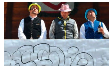
„SketchUp“ - pec da ri cun la grupa de teater univel mustrà sun l Marcia da La Poza

N chëla sada fovel propi n bel di da surëdl y nscila se à jënt de duta la valeda tëtut la bria de uni te Sëlva a marcià. Zënzauter se lascëssel fé zeche deplù ora de chësc marcià tradiziunel,