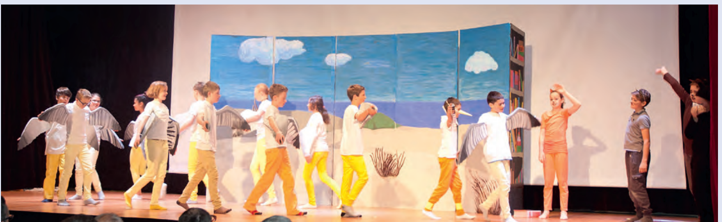
Sculeies dla doi prima tias à lascià udëi l teater "Storia di una gabbianella e del gatto che le insegnò a volare" de Luis Sepúlveda.

studënc. Lessù iel pona unì mustrà na animazion cun trupea de bela fotografies che à mo n iede ulù lecurdé duta la fases che ie unides a s'l dé ntan chisc doi ani de frabicoz. Davia che tla medema nfrastruttura ie da cësa nce la scola de mujiga de Gherdëi-