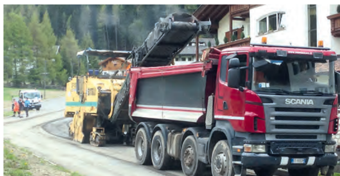
Do unì inviern iel inò èura de cuncé su tretuars y asfalté stredes.