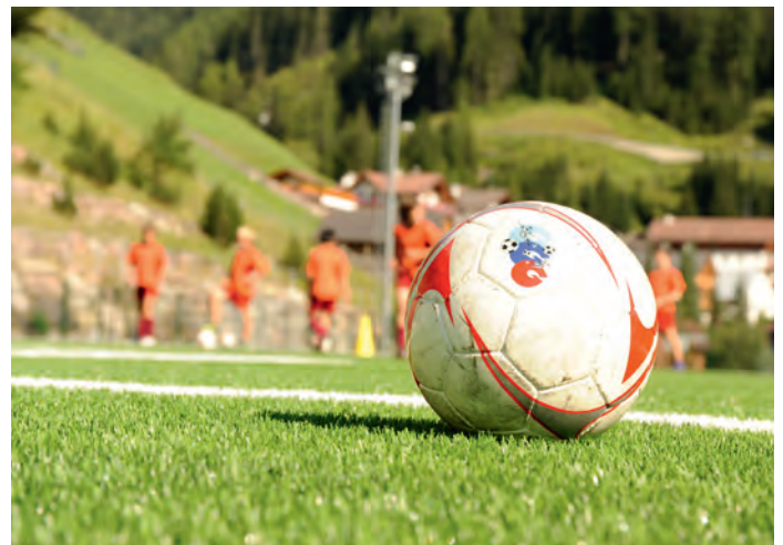
Sun l bel fonz sintetich iel dastramp bel a pratichè l sport dla codla

Tl Bar Dopolavoro te Plan puderà - chiche ie registrà - jì a se to la tlé y jì a fé ala codla sce l ciamp ie da garat. Ntan che n fej damat ne saral degun vardian, perchël se damanden da duc i sportives mpue de fundamënt y respet per la nfrastutura. Sambën possa nce vel grupa, lia o squadra se nuzé dl ciamp nuef. Nce tlo velel che n muessa vester registrei y sèurapro val debujën de rerservé la plaza