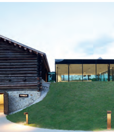
L “ Tublà da Nives ”, ejèmpl de architettura moderna ma che tèn cont dla cultura de frabiché da ntëuta.

Architettura dessènia la cuntreda y chël vel dantaldut per la cuntreda da mont sci che chëla che on te nosc racion. Sota l moto „ Ins Land gebaut “ iel ntan i „ Dis dl'architettura “ unì mustrà su deplù ejèmpli dla cultura dl fabriché te Südtirol. L ie unì pità n valguna jites per jì a ti cialé a de vedli luesc da paur, cëses privates modernes, hotiei de paruda y strutures publiches. L fin de chësta scumenciadiva ie chëla de mustré su la caracteristiches y particulariteies dl frabiché che l ie tlo da nëus. Sun l program fovel nce na jita tres Gherdëina; l argumënt se dajova ju cun la costruzions nueves “segures de sé” che chir na puzizion nueva tla cuntreda y che tl medem mumënt liëia te n aspet culturel l tradiziunel cun l contemporan. N tel ejèmpl ie zënzauter l “ Tublà da Nives ” che ie unì crì su da architec y nteressei.