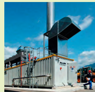
L'impianto di fermentazione a Lana