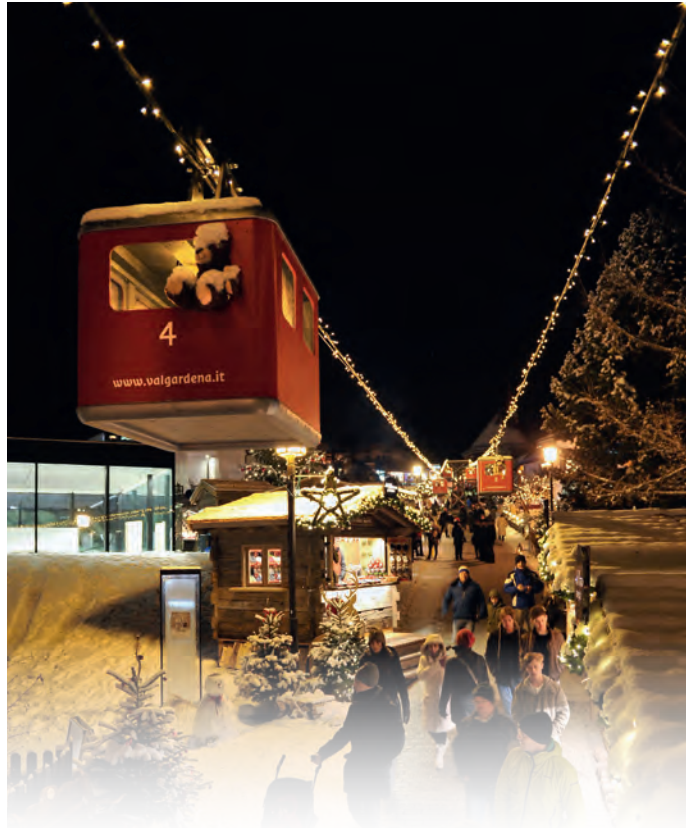
L'idea de mèter su na furnadoia cun de tel pitla condles à drèt plajù, dantaldut pra i fulestieres

Te Sëlva à l marcià da Nadel inuem "Nadel da Mont". L ie n inuem che ie nasciù per cajo, rujenan te na sentèda dl cunsèi dla Lia per l Turism. Plucheauter iel uni pensà a duc chisc marcies da Nadel che ie nasciui te curt tèmpe te belau uni luech de nosc raion. Nscila uloven te Sëlva se desferenziè mpue, ti dajan dantaldut na gran mpurtanza che l ie n marcià da Nadel tla montes, a 1.500 metri de autèza, dlongia i crèps. Perchèl fova tosc tumà l binom drèt passenènt "Bergweihnacht - Nadel da mont". Ma n ulova sambèn nce comuniché chèsc ai ghesc da plu dalonc y che i ntènde de ciche l se trata y nscila iesen ruvei sun la dizion nglèisa "Mountain Christmas".