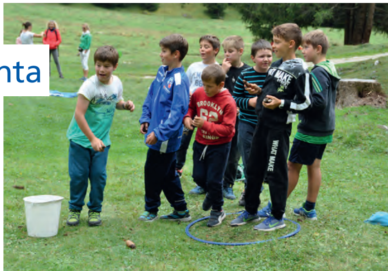
La premiazion dla scumenciadiva „Hipp, Hipp, Hurrà... biblio Instà 2016“ ie unida metuda a jì chëst iede alalergia. Mutons y mutans se à deverti te Val fajan juesc tl bosch

Per duta la tlasses iel stat la premiazion dl'azion - ènghe te Val - ulache nosta dirijën-