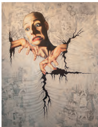
Portrait de Medea Moroder