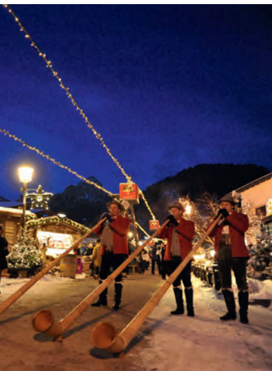
Chèst ann saral da audi sunadèures pra l "Nadel da mont"

Nfurmazions giapen nce te internet sot a www.mountain-christmas.com