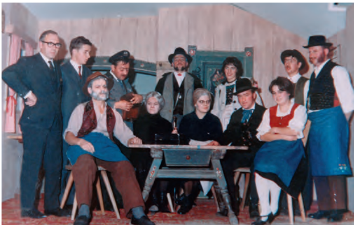
La grupa che ova purtà dant l pez "L'arpejon" dl 1966. Chësc ie uni definì sciche prim pez de teater dla lia "Teater de Sëlva".

deniamënter cun na lingia mpurtanta de ntraunides y manifestazions. Danter chëstes nce la mostra tl Tublà da Nives, giaurida ai ot de utober y che jirà inant nchina ala fin dl mëns. Ti cater salamënc dl Tublà da Nives vëniel mustrà fotografies, chedri, films, video, placac y statistiches che documentea la storia di 50 ani de chësta lia. Oradechël