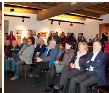
Autoriteies pra la giaurida