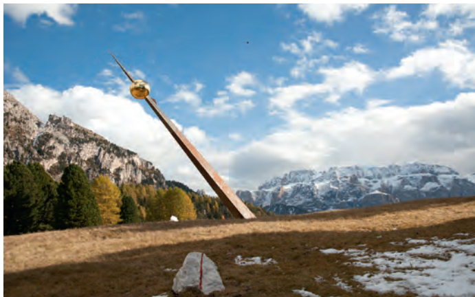
Nscila cëla ora la gran ëura dal surëdl sun Juac

de Juac, n bel raion de nosc luech ulache l dà surëdl dut l di. L lëur de mesurazion y nstalazion dl’ëura à fat Roland Moroder che à metù su nce n gran zogher de Cor-ten (ca. 10 mt aut) cun na codla ndureda sunscom che à n diameter de 80 cm. La dumbria dl zogher tumerà sun pra ulache l ie giavei ite sasc blanc che reporta la zifres dl’ëura.