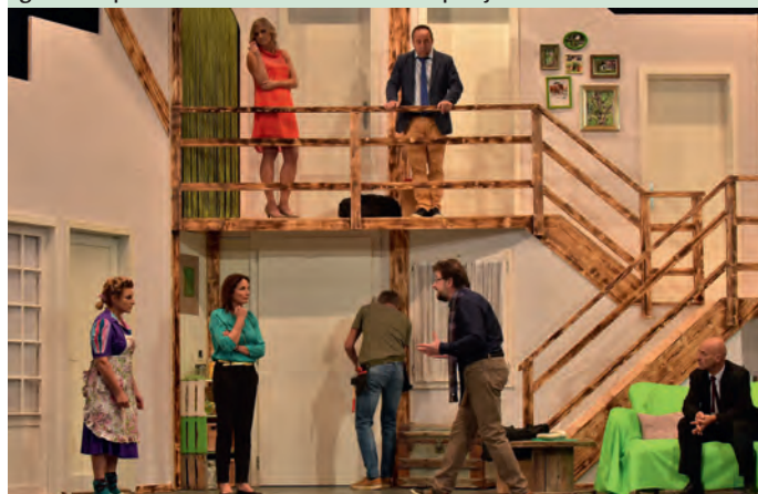
Na scena ora dl teater „Bel da unì mac”