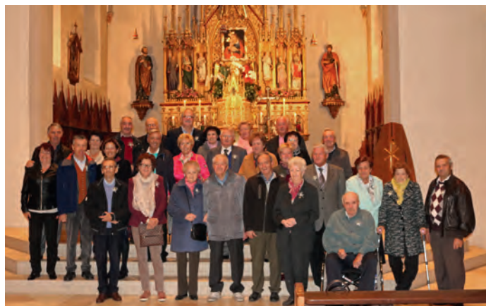
Iubilar pra la festa che ie danter 40 y 60 ani maridei