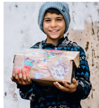
Zaubern auch Sie ein Lächeln der Freude mit einem kleinen Weihnachtsgeschenk.

Genaue Informationen zur Aktion findet man in den Faltblättern, unter www.weihnachten-im-schuhkarton.at und unter Mob. 366 37 41 116 .