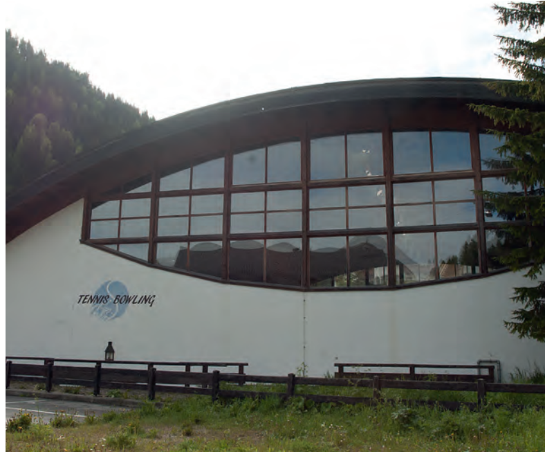
Il Comune di Selva Gardena è divenuto unico socio della Società per attrezzature sportive Selva a.r.l.

È stato preso atto con alcune osservazioni della bozza del piano sanitario provinciale 2016-2020 .