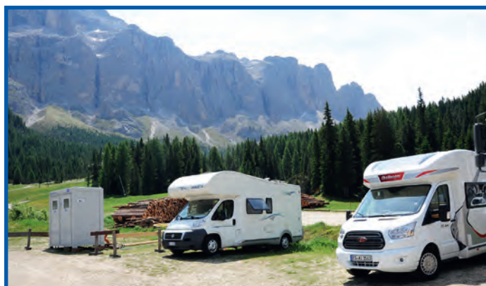
Per la stagione estiva 2017 è stata concessa alla Pranives S.r.l. la gestione del parcheggio per autocaravan in località "Plan de Gralba" e, in occasione delle manifestazioni ciclistiche, il parcheggio in località "Plan".

In seguito ad avviso pubblico è stata approvata la graduatoria per l'assunzione di due tirocinanti durante l'estate 2017.