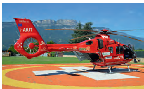
Der Hubschrauber H 135 T3 des Aiut Alpin Dolomites.

Die Rettungseinsätze werden mit dem Hubschrauber H 135 T3 (90 Meter-Seilwinde und Doppellasthaken) geflogen. Zur Besatzung gehören ein Pilot, ein Windenmann und ein Wiederbelebungs-Arzt. Rettungsleute sind freiwillige des Bergrettungsdienstes des CNSAS und BRD-AVS.