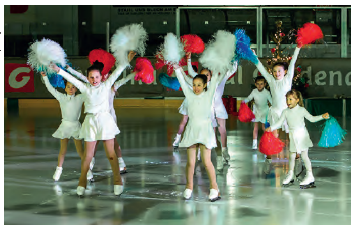
"Nadel sun dlacia" - Eisclub Gherdëina