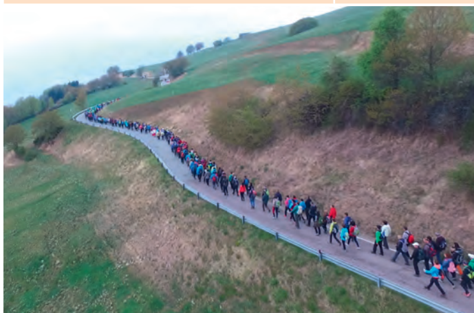
Pellegrinaggio verso Sabbiona