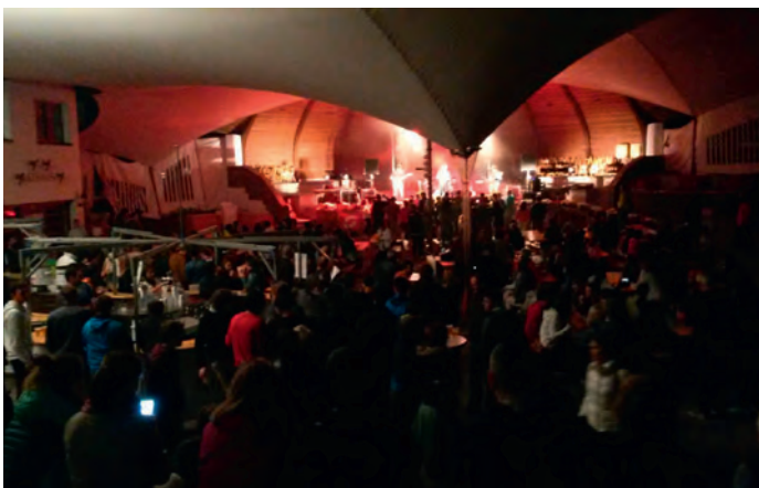
Jëuni Rocking' Sëlva (2016)