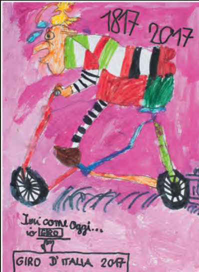
1. PEST Luca Senoner 2 a tlas

Nce i sculeies dla scola elementera de Sëlva à ulù ti dé l bènuni al "Giro d'Italia" che ie passa te nosc luech ai 25 de mei. Tla classes (ora che la prima) iel uni metù a jì n pitl cuncors de dessèni/pitura y la premiazion ie stata pona ai 22 de mei danmesdi te scola n presènza de rapresentanc dla scola y de chemun. L ie uni laudà la bona idées, la creatività y l savèi artistich di sculeies; n valguni à abù na mièur man y si dessèni ie uni stampà sun n totem de 2 metri aut. Chèsc fova nce l pest per i pitli artisc. Chèst ann ne n'iel no mé l anuel di "100 ani Giro d'Italia" ma l ie nce 200 ani ca da canche l fova uni nventeda la roda da pedale.