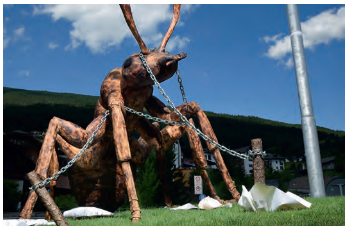
"Idea Unika" (2015)