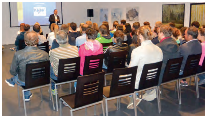
Truèp jëuni ti ie unic do al nvit y ie unic a se to nfurmazions de prima man ncont dl frabiché lesierà.

Sëlva y Gherdëina ie na destinazion turistica drèt cunesciuda y avèi tlo na cësa, n cuatier ie n avèi che à nce n cër valor. Y chësc fenomen à n nflus nce per i jëuni che uel se fé su na cësa, n cuatier, te nosc luesc.