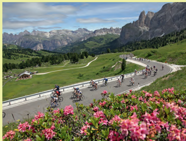
Die Passstraße zum Sellajoch wird an allen Mittwochen für motorisierte Fahrzeuge gesperrt.

Pordoi Joch/Sella Joch. An diesen "#Dolomitesvives Mittwoch" werden geführte Wanderungen rund um das Sellajoch geboten. Mit Veranstaltungen rund um die Küche, Musik und Geschichte der Ladinischen Dolomiten kann die Bergwelt auf besondere Weise und mit allen Sinnen erlebt werden. So gibt es eine „Taste tour“ mit Leckerbissen aus regionalen Zutaten von Sterneköchen zubereitet auf sechs Hütten, Treffen mit Persönlichkeiten aus dem Dolomitengebiet und Konzerte lokaler Musiker. Den Anfang am 5. Juli macht der Bergsteiger Reinhold Messner.