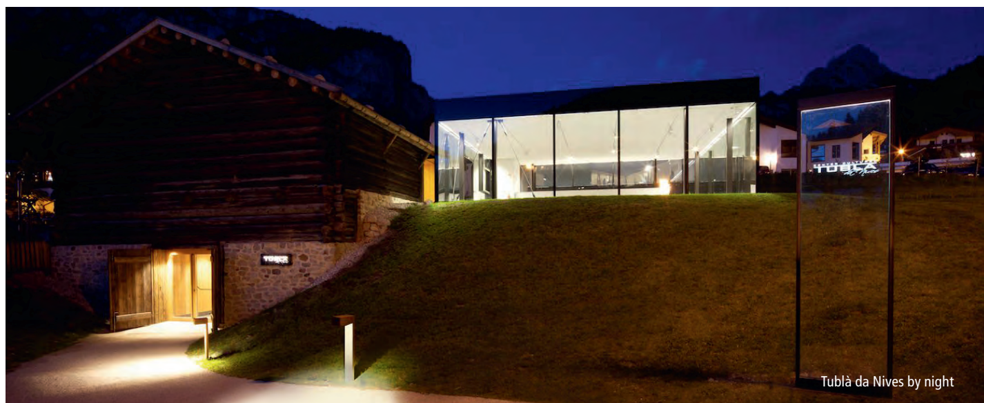
Tublà da Nives by night