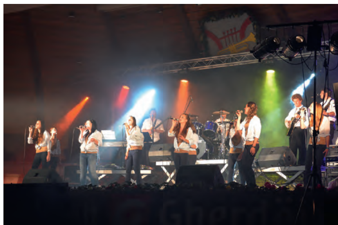
"Hosianna in concert!"