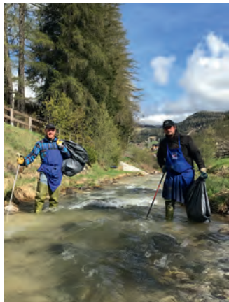
Nchinamei te ruf vëniel scirmà d'uni sort de refudam.

N sada, ai 13 de mei, se à ancuntà ngrum de ulenteres per jì deberieda a rumé su nosc luech. Nia da crèier cie che l ie dut uni abinà: bostli, bozes, tascas, plastica, gumi, nailon, sachetli, cabli, roles, fuscà da jì cun i schi y n madroz... purtrüep n grum de maroca! Ngrum de lies (p.ej. i scize-