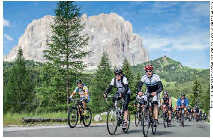
Sellaronda Bike Day