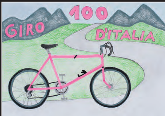
1. PEST Nina Nocker 4 a tlas