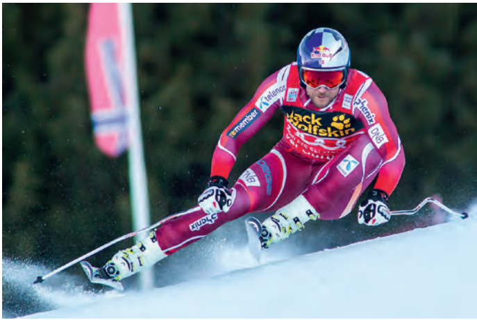
Aksel Lund Svindal in azione sulla "Saslong"