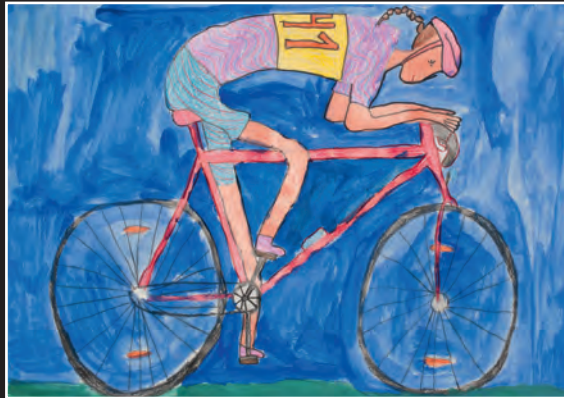
1. PEST Natalie Senoner 3 a tlas