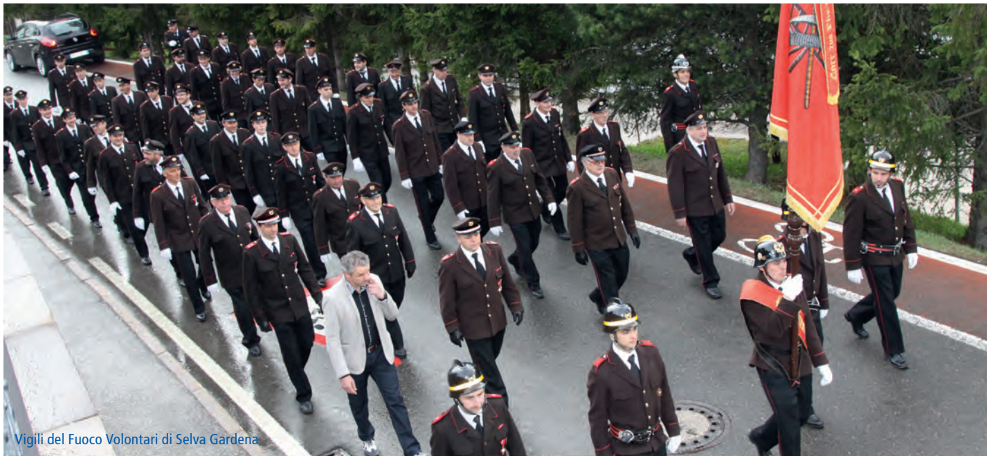
Vigili del Fuoco Volontari di Selva Gardena