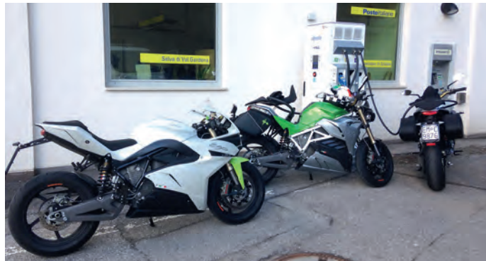
È stata installata proprio a Selva la prima colonnina elettrica veloce delle Dolomiti, una Fast Charge da 50 kW.