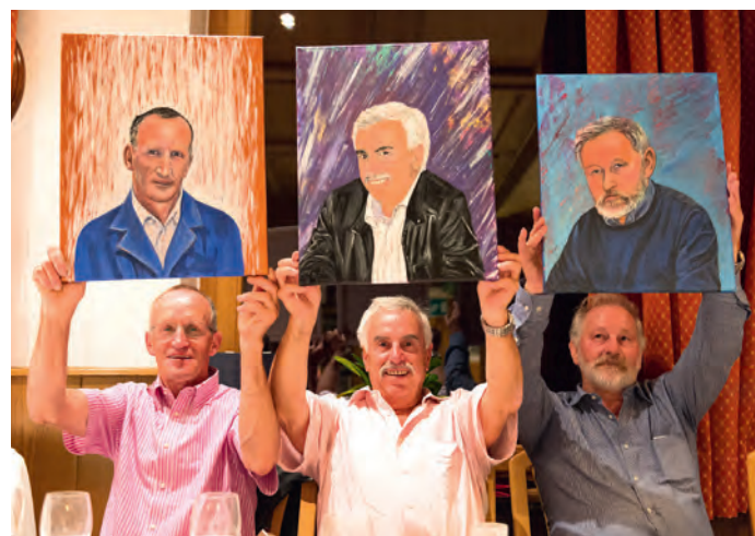
I trëi festejei cun na si caricatura.

y l'assessëura ala cultura y scoles de Sëlva. Sibe l ntendënt ala scoles la dines che l'ambolt à auzà ora la gran responsablità, la dedizion y l mpëni che uniun te si ncëria à desmustrà te chisc 40 ani de servisc tla scola unfat ciuna pert de ncëria che l à tët ite. L lëur dl bidel, che à aldidancuei suvënz nce da se dé ju cun cuestions y stroc technics, ie na ncëria nia da sotvaluté che se damanda mpëni, prezijion y flessibilità. Mpurtanta ie la didatica dl nseniant ulache for plu y