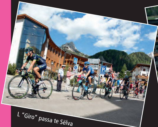
L "Giro" passa te Sëlva

Sun plaza Nives ie nce ruveda la "Carovana del Giro" che à fat drèt na bela atmosfera ca. 1 èura dan che passova i "giri-ni". Nosc sculeies à abù la bona idea de rapresenté l numer 100 (100 ani Giro d'Italia) sun Pra da Nives. Nscila pudova l joler che tulova su la manifestazion sportiva fé na ripreja dal aut ju. N valgun mutons stajova mpe, autri furnova cun la roda fajan la doi "nules" dla zifra 100, duc canc furnii cun na malieta rosa ulache l fova da liejer "Sëlva saluda l Giro".