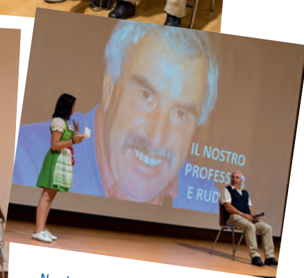
N valguna mprescions dla festa