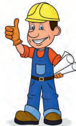
L frabiché lesierà ie una na puscibltà per i jëuni per ruvé pra n cuatier.

Coche bele nunzià nascel tl areél „Anri“ tosc na segonda cësa; i zitadins che possa fé pea se à metù adum te na cooperativa y vën cunsièi y cumpaniei dala „Arche“ dl KVW. Na zitadina che ie tl lëur de fé pea pra l frabiché lesierà à cuntà dla bona cunlaurazion y dl sustèni da pert dl KVW dijan che pra de tel ndesfidedes sciche l frabiché deberieda iel mpurtant muètrà na bona ulentà, jan ite datrai vel cumpromis y azetan la dezizion dla maianza.