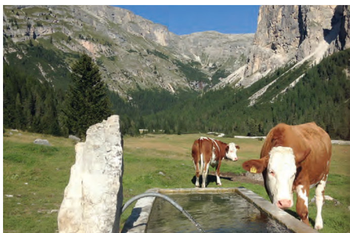
Bestiame all'alpeggio in "Pra da Ri"