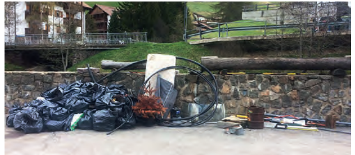
N bel mudl de maroca vëniel abinà adum uni ann pra l di de "Rumé su nosc luech"

giné ciche la jënt smaca tan ncantëur. La lia de chëi che va a pië pësc ie mueda da ruf ite y nce tlo an abinà ngrum de maroca. Coche reingraziamënt iesen mo duc adum jic a marënda te na ustaria dl luech.