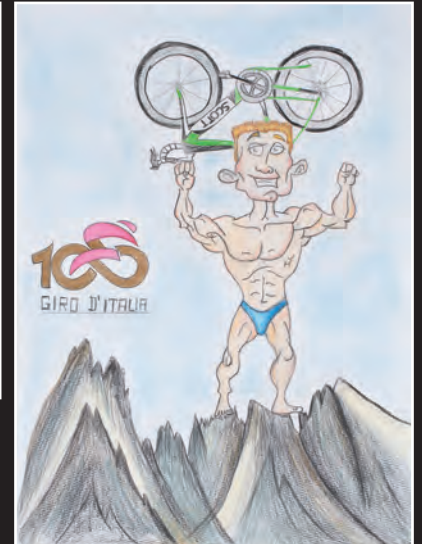
1. PEST Leon Mussner 5 a tlas