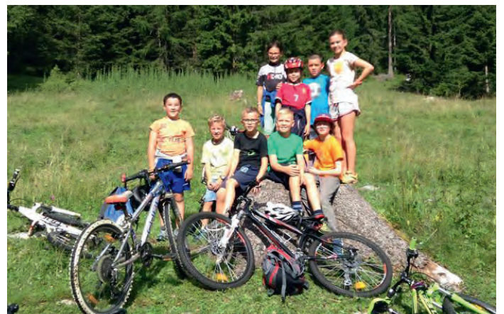
"L Pavël" (2016)