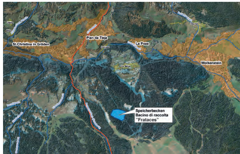
Localizzazione del bacino di raccolta "Frataces"

È stato approvato il documento di revisione delle partecipazioni societarie detenute dal Comune . Tutte le partecipazioni sono state confermate, essendo già stata operata negli anni scorsi una razionalizzazione nel limite del sostenibile. Attualmente il Comune detiene, come socio unico, le quote della Pranives Srl, e, come socio di minoranza, partecipazioni al Consorzio dei Comuni, alla Selfin Srl, alla Alto Adige Riscossioni Spa. e alla Eco-Center Spa.