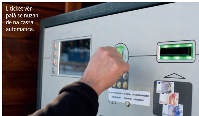
L ticket vèn paià se nuzan de na cassa automatica.

Chēsc sistem de tarifa ie zēnzauter plu rèidl y ti va ncontra a chiche va me cun i schi n valgun'ëura. Per chiche stà ora dut l dì ti vèniel cunsià de piè via cun i schi dal zēnter dl luech o, sce i vèn da demez caprò, de lascé si auto bele ora Ruacia, smendrian nscila l trafich tres l zēnter de Sëlva.