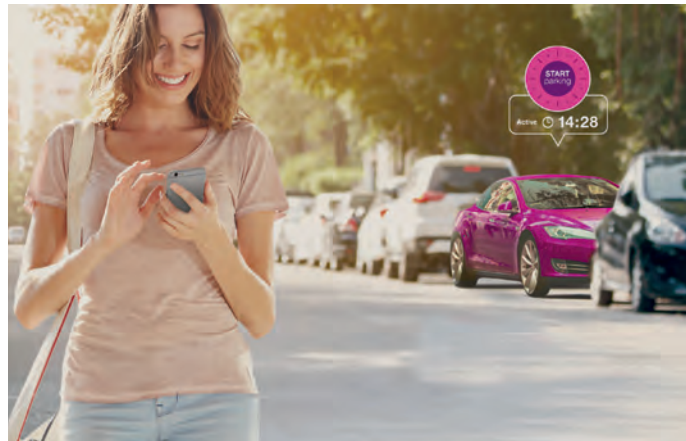
Mit Easypark kann man mit dem Smartphone kann man die Parkzeit aktiviern

Unter www.easypark.de kann man weitere Informationen einholen: sehr interessant ist auch die Echtzeit-Darstellung der verwendeten App in ganz Europa. Verwaltet wird dieses System von der Firma Easypark Italia GmbH mit Sitz in Mailand.