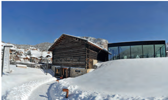
L "Tublà da Nives" zënter culturel che se à fat n bon inuem nce a nivel provinziel

dré nce truep lëures che l à fat da jëunn, ntan l studio y pona man man su per i ani. La mostra ie davierta uni di (ora che ai 24.12. y ai 31.12)