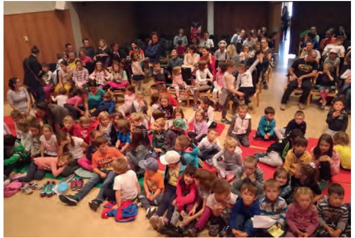
Truep mutons y mutans à tët su l nvit y ie unic al “Erzählfestival”