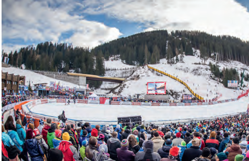
Tl raion dl travert ja Ruacia