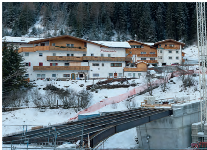
Stanno proseguendo i lavori presso il ponte „La Sëlva“