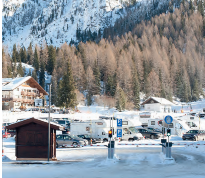
L azés ala plaza da parché sun Plan de Gralba

per chēi che l ie dantaldut da tenì ite n standard de cualità, ne cialan nia mé sun la conveniēnza economica. Per la plazes dai auti se trael ènghe de ruvé n puech al iede a na gestion uniteira y coerēnta cun i fins dl plann dl trafich y cun l cunzet de manejamēnt dl trafich su per i jēufs. Chēsc se damanda de fé do y do nvestimēnc, de se giaurì a soluzions urganisatives nue-