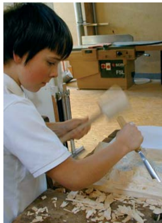
N scule ntan che desmaza.