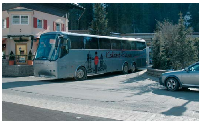
Il marciapiede che si immette sul ponte "Mauriz" verrà allargato

di manutenzione. Al riguardo è stata incaricata la ditta Telmekom S.a.s. di Reiterer Robert & Co., concessionaria di zona dei prodotti Siemens, per una spesa preunta di 22.800 Euro.