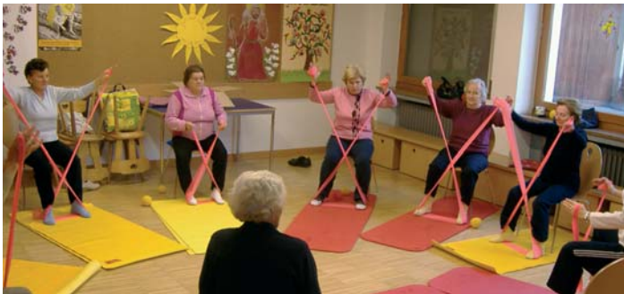
Tosc puderà i seniores se ancunté tla "Stua di Seniores" te Calonia.

Per ntant iel nce da se festidiè de mèter adum n blòt prugram, acioche vosta ancunte-