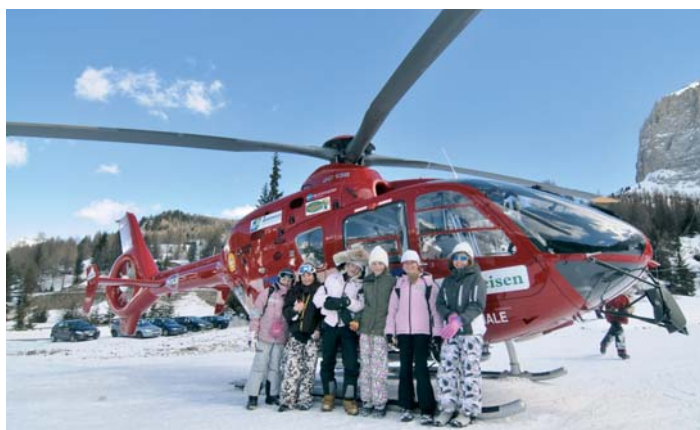
N mumènt drèt aspità fova udèi l joler dl Aiut Alpin. Sambèn che trueps à ulù fé na foto lecord cun l gran “ucel”.

à cumetù ai mutons de ne jì mei da séui ora de purtoi ajache l po vester scialdi periculèus. Èi ti à mustrà cie che toca te uni flucion de chëi che va a fé jites cui schi: n piepser, na sonda y na pela. I mutons à nstèsc pudù prué ora coche n manejea chisc njinies. La stazion suinsom fova unida njenieda ca dala verdia furestela. Tlo à i mutons pudù cialé tres l microscop coche cèla ora i cristai de nêif y chësc ti à a truepesc sapù na cossa de marueia. Cun n ejèmpl pratic ti iel unì mustrà canche na levina se destaca y te cie situazion che l ie l plu periculèus.