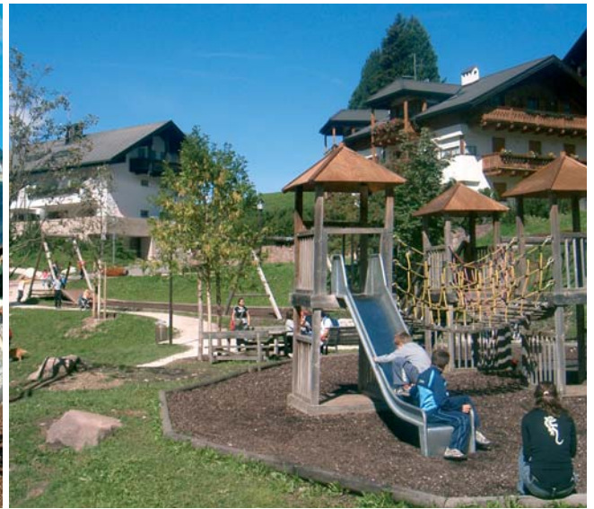
Unsere Kinderspielplätze sind naturnah und zentral angelegt