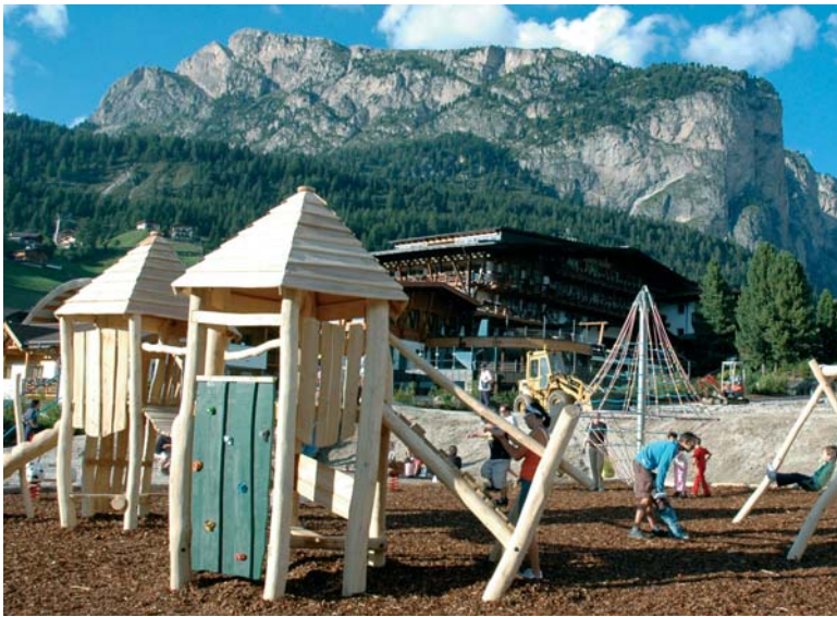
Der neue Spielplatz im Zentrum Wolkensteins