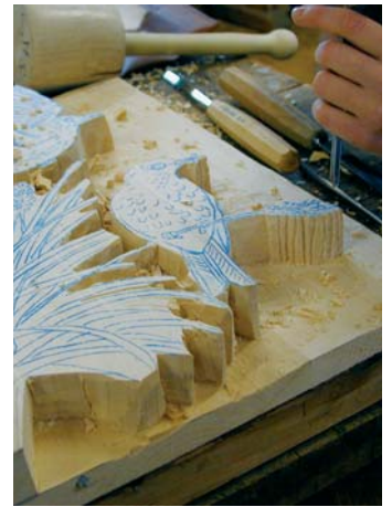
N lèur che sarà da udèi tla mostra