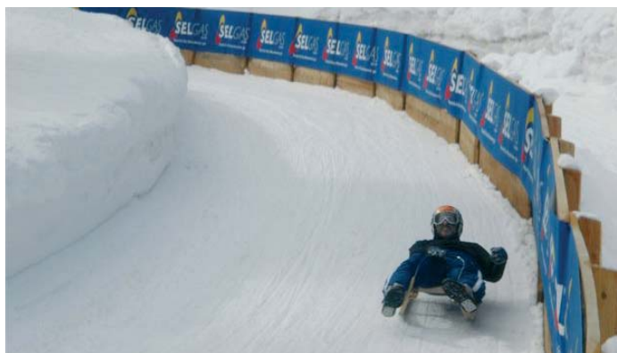
Ntan la garejeda

Sia lauda i Diè sia benedi i Diè sia ringrazia i Diè, kèl nès a da la Confesion, kè l' nes da la Contrizion, kèl nès a duna lega dèl santo Batèisum. Sia lauda i Diè sia benedi i Diè, sia ringrazia i Diè, kèl nès a duna na bella ana dèn self, atschio chè pudons viver i adure in Eternità.