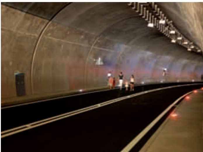
N l di dla giaurida pudoven jì, zënza trica, a pé tres l tunnel...