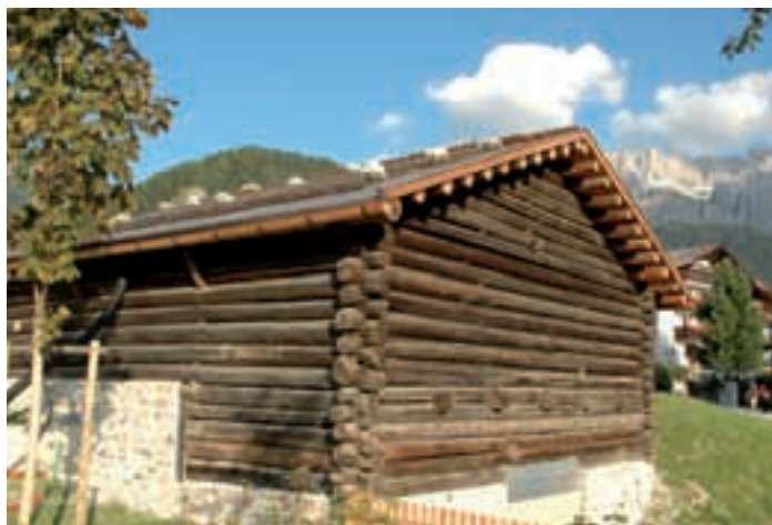
Il progetto per la ristrutturazione del "Tublà da Nives" prevede una spesa complessiva di Euro 1.592.654,00