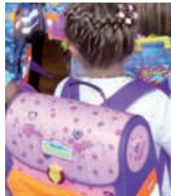
Schultaschen schon gepackt? Bald ist es wieder soweit; Das neue Schuljahr steht vor der Tür.

Wie bereits im letzten Schuljahr werden auch im kommenden Schuljahr die Leistungen und das Betragen der Schüler in Ziffernoten bewertet, wobei in allen Fächern eine positive Leistung (mindestens sechs) notwendig ist, um in die nächste Klasse versetzt zu werden oder zur Abschlussprüfung der Mittelschule antreten zu dürfen. Im Rahmen Abschlussprüfung der Mittelschule ist wie bereits in den letzten 2 Jahren