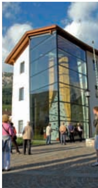
Die neue Kletterwand am Nivesplatz: ein Anziehungspunkt für Einheimische und Gäste

terrouten. Anschließend konnten alle Interessierte die Kletterhalle und das neu eingerichtete Bergführerbüro besichtigen und selbst das Klettern erproben. Der HGV Wolkenstein lud zum Buffet ein.