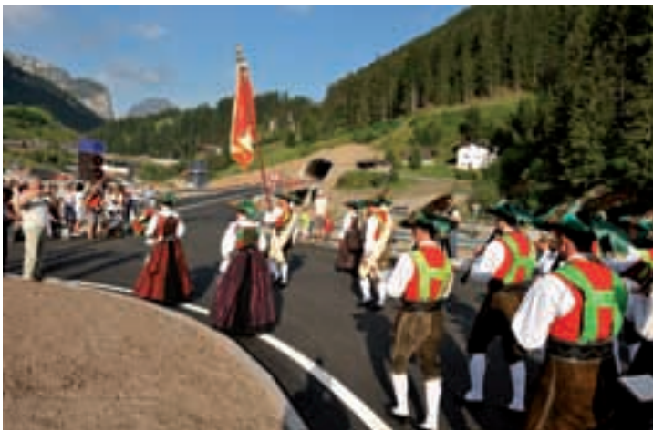
La Mujiga de S.Cristina à abeli la festa. Dovia vèijen l tunnel "Saslonch"