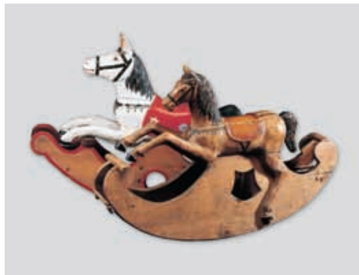
Ciavei da sbinghé

Ai sculeies ti savova nce bel a fé ala slaidra y sambèn a lesta, for sun plaza de scola, che fova nce plaza de dlèja. Ala codla univel nia propi drè fat, che n ne ova pu deguna; vel l'oma fajova poverter una de pezes da tré mpue via y ca. De mei ne fovel zeche plu de bel, canche n univa dala curona de mei, che l fé a lesta. Chi pei de lèn sun èur de streda y a toc la sieves de lèn fova da