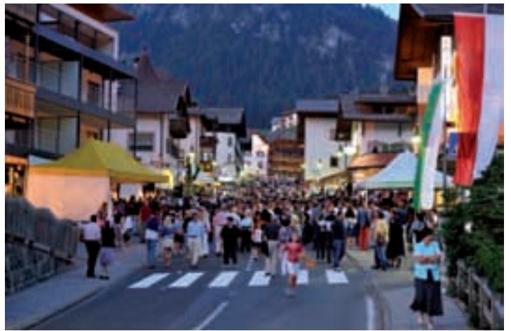
Cun la streda de zircunvalazion à S.Cristina giapà n raion da jì a pé