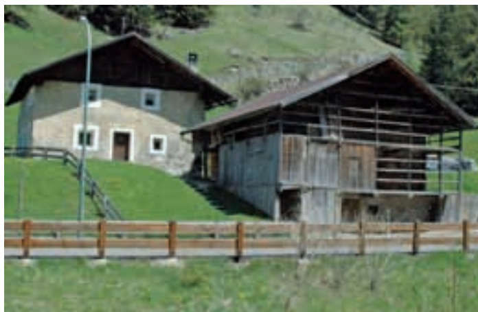
La proposta per una destinazione pubblica del maso "Curtinea" prevede la rivalutazione del vecchio maso.

che prevede la sostituzione dell'impianto di raffreddamento della pista di pattinaggio e la riqualificazione energetica dell'edificio per una spesa complessiva di 1,7 milioni di Euro. I relativi lavori saranno eseguiti nella prossima primavera durante il periodo di chiusura dell'impianto. Per garantire i tempi tecnici per l'elaborazione di un progetto di dettaglio da parte degli offerenti e per la scelta secondo il criterio dell'offerta economicamente più vantaggiosa, occorre però avviare immediatamente la procedura d'appalto.