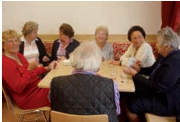
Te "Stua di Seniores" vëniel cartà dassënn...

L cunsèi di seniores se à pona cruzià per i lëures y finanzia-mënc n cont de aredamënt y mubilia che ie unic fai chësc ultimo mez ann. L lëur da tislèr ie unì fat da "La Uega",