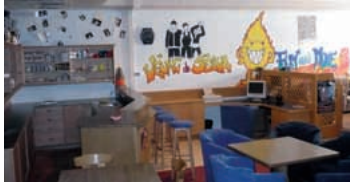
La sala di jëuni "Fun and more"

Ajache bele ti ani passei fovel uni a s'l dé problems, an chëst'ann fat l regulamënt plu sciorf, auzà la cauzion, cuntrolà ntan la parties y ti l à sambën cumetuda ai chëi che se mpresta ora la sala. Purrempò ne se à n valgun jëuni nia cumpurtà sciche l se toca, ne à nia teni ite l regulamënt y