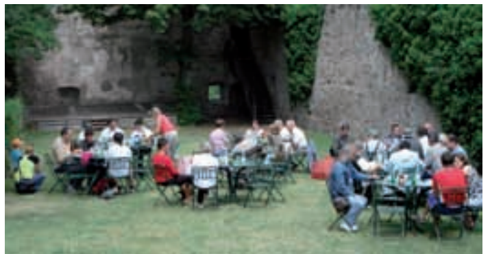
Alljährlich treffen sich die Freiwilligen HelferInnen der Gruppe „Deberieda“ zum Grillfest. Heuer fand das Fest auf Schloss Prösels statt.

Die 12 Freiwilligen HelferInnen waren im vergangenen Jahr knapp 700 Stunden im