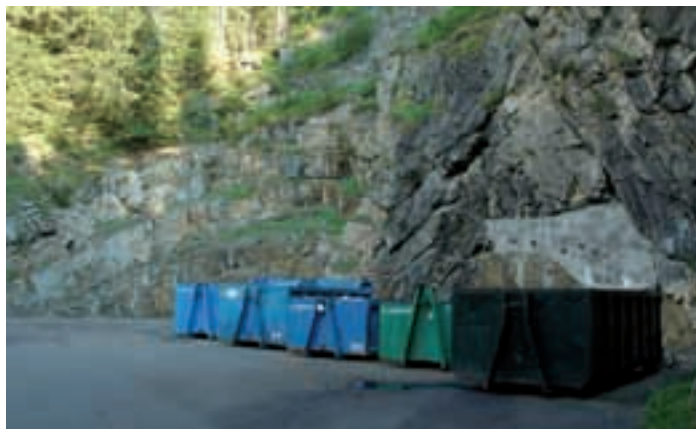
Per la realizzazione di un centro di riciclaggio in località "La Poza" è stato approvato il progetto definitivo

Una parte dei lavori, il risanamento del vecchio fienile, è già stata eseguita in base ad un primo progetto stralcio. Nel prossimo autunno sarà realizzato il tratto nuovo costituito dal cubo in vetro. In seguito alle procedure negoziate esperite per l'appalto,