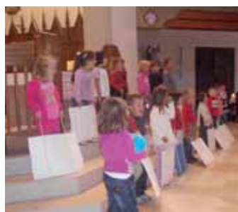
Mutons y mutans à abeli la mëssa