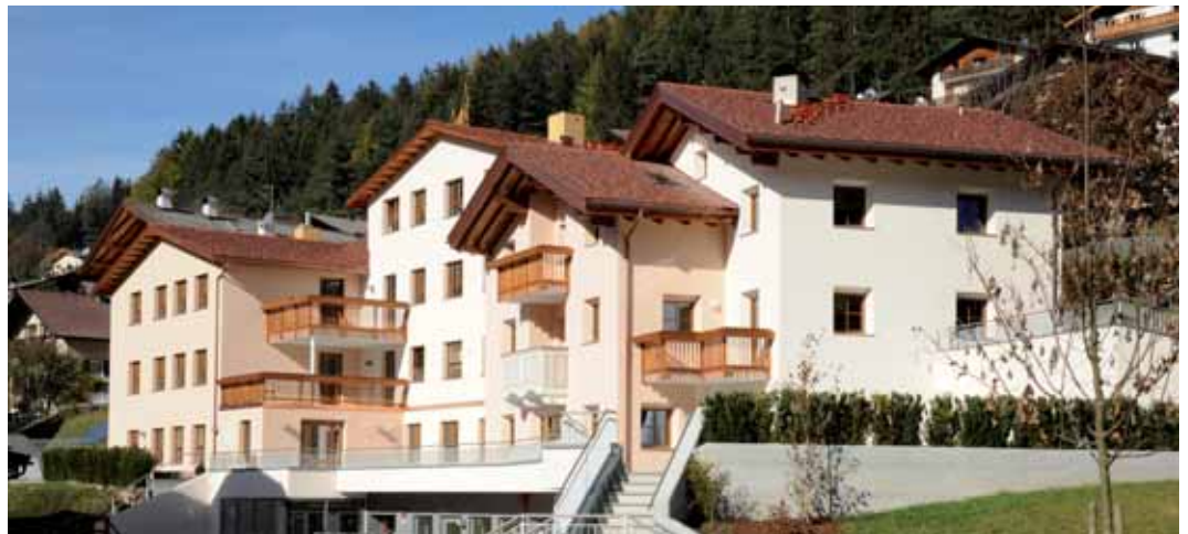
Der Umbau des Hauses Locia in St. Ulrich ist nun abgeschlossen.

zeitweise anmieten. Somit steigt die Auslastung, aber auch die Möglichkeit finanzielle Mittel einzubringen. Weiters einigte man sich auch über die Durchführung eines Projekts zur Einführung einer neuen Festkultur in den Mitgliedsgemeinden. Dabei geht es darum, vermehrt für den Verzehr von nichtalkoholischen Getränken zu werben. Das 3-Jahres-Projekt sieht die Einbindung und Sensibilisierung vor allem der Veranstalter von Festen bzw. der verschiedenen Vereinsvertreter in allen 13 Gemeinden vor.