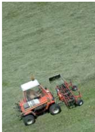
La mascins da sië ie al didancuei na gran sauridanza

A sië i prei di autri ne n'iel nia for tan sauri, ajache vel un o vel auter patron à tème che l pra pudessa ti uni tët. L ie deplu puscibilteies per regu- lamenté l sië te chësc cajo. Sce n à na majra puscion pu- dèssa vester na bona soluzion chëla de ti dé n afit al paur l pra tres n scrit (Pachtvertrag) che vel n tan de ani. N'otra soluzion per de mèndri toc ie chëla de ti mpresté l pra me da sië (mündlicher Leihver- trag): chësc posson fé tres na comunicazion cun firma ala forestela. Te tramedoi caji à da una pert l patron la segu- rëza che l pra vën sià y che do n tan de ani posson inò fé cie- che l uel limpea y da l'otra pert ie l paur segurà a lauré sun chësc pra y possa ënghe se damandé i cuntribuc per si lëur. Sce n à me tei pitli fazu- lèc de pra ntëur cèsa y n à nia dlaurela de se i sië nstèsc, fos- sel mo na terza soluzion y plu avisa chëla dé ti dé su l lëur a paiamënt a zachei d'autri (per ejèmpl ala dites che fajova o fej chësc lëur per cont dl che- mun).