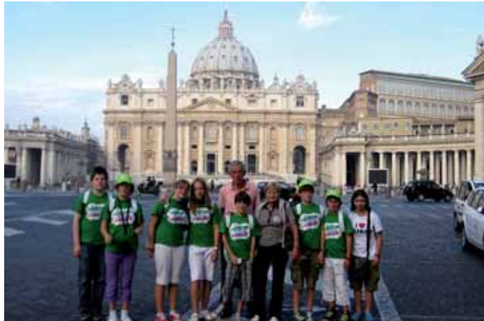
Sculeies de Sëlva a Roma

Bele ntan la festa de giaurida à la reprejentanza ladina pudù vester leprò pra n program culturel cun artisc cunesciui, stars dla mujiga pop y sportives de suzes nternaziunel. I sculeies de Sëlva fova unic cris ora per avèi fat n proiet sun la segurèza tla montes che à drèt plajù ala cumiscion.