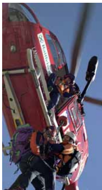
287 Hubschrauberrettungs-Einsätze hat Aitut Alpin Dolomites im letzten Sommer durchgeführt

Bereitschaftsdienst am Heli-Stützpunkt Pontives geleistet haben und auch jenen, die bei den Bergungen mitgewirkt haben. Ein ganz besonderer Dank geht weiteres an alle Gönner und Spender, mit deren Unterstützung wir weiterhin rechnen. Wir bitten alle Mitbürger, die unsere Tätigkeit anerkennen, um Mithilfe; nur durch Ihre Solidarität können wir auch künftig den Menschen in Bergenot und anderswo helfen. Aitut Alpin Dolomites unterstreicht auch die gute Zusammenarbeit mit der Landesflugrettung der Provinz Bozen-Südtirol und mit der Landesnotrufzentralen 118, über die auch die Notrufe der anderen Provinzen eingehen.