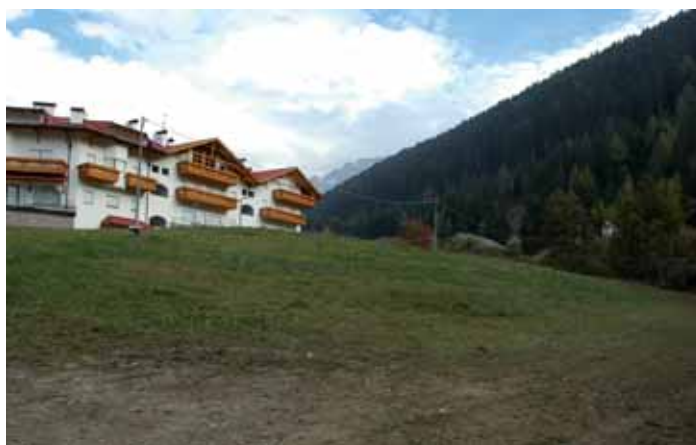
Nella zona produttiva "La Poza" è stata avviata la procedura d'esproprio dei terreni