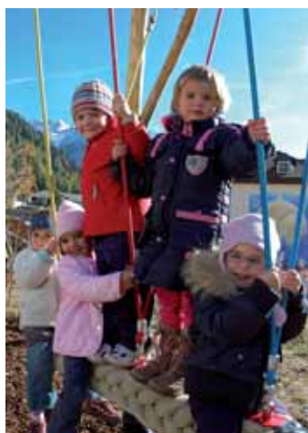
La retta mensile della scuola materna è stata aumentata in media di 1 Euro