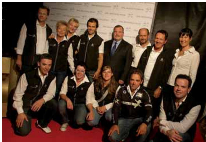
L team de Sëlva Active pra la premiazion dl SMG Marketing award a Bulsan

N'otra idea che ie unida realiseda chëst ann à giapà si bel inuem te "Sëlva Active". Canche àn scumencià cun na prima idea dan doi ani, ons pensà che l fossa ideel sce fussan boni de abinë n 50 mprejes gastronomiches (hotie, pensions, garnis y privac) che fajëssa pea chësc program paian l cuntribut de 15 euro per liet. L ie stat na bela nutizia audi che te curt tēmp fans stac boni de ntusiasmé bën 129 "Betriebe" cun belau 4000 liec per chësc proiet. Chësc ie stat per nëus che àn metù ite duta nosta forzes te chësta scumenciadiva n gran sèni de crëta tl proiet y te nëus coche Lia per l Turism. Pensà fovel uni dantaldut per la cëses che ne n'a nia nstësc n mëinacrëp y che pudova a