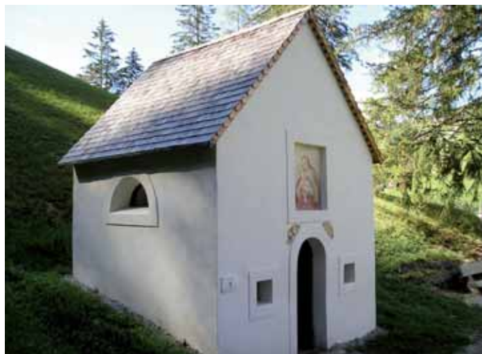
La capela Santa Tili se mostra te n bel guant nuef