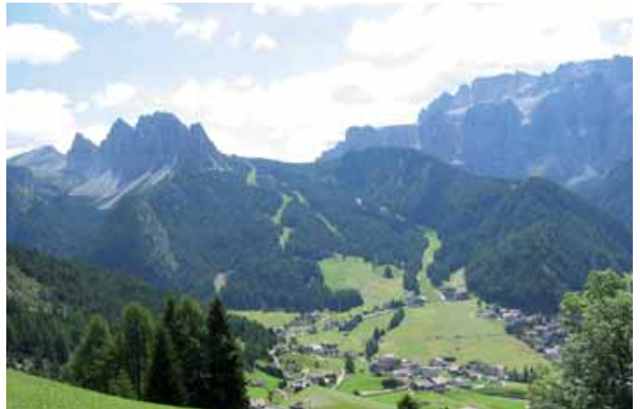
N luech sià ora scialdi nèt ie na bela cherta da vijita.

Plu da giut ova belau uni luech cun pitla o gran puscion bestiam o almanco na cèura per avèi tant da viver. Cun i ani à pona sambèn la cum-