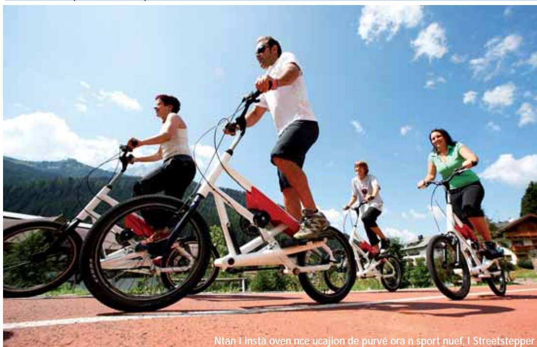
Ntan l instà oven nce ucajian de purvé ora n sport nuef, l Streetstepper