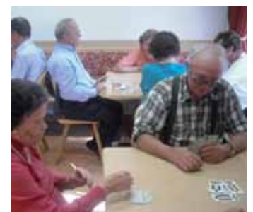
Carté y stiché te “stua”.