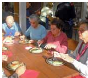
N bon bucon toca pra uni festa