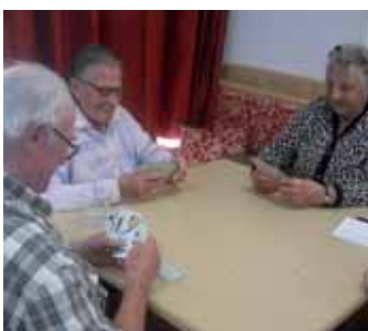
Na bela carteda

Do l tai dla pinta à duc pudù dé na udleda ala stua pra ze-