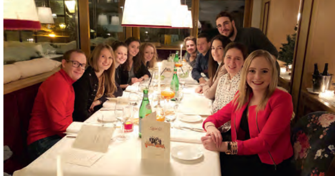
L cunsèi di "Jèuni de Sëlva"

Coche uni ann possa i jèuni nce chëst ann se nconfer-tè sun n program rich y plën de bela manifestazions. Truepes de chëstes ie urmei bele tradizion sciche l