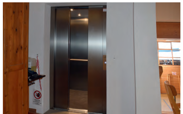
L lift nuef tla palestra "Pranives"

L lift te cësa de chemun alincontra ie mo fërm y aspieta che l vënie fat la colaudazion. L vedl lift se ova rot y nsci oven fat ora de n fé n nuef. Èl cunliëia duc i partimënc ie