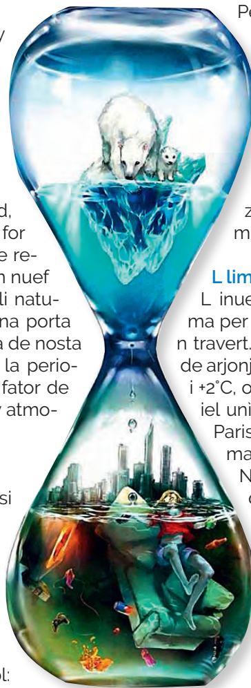
Uni un de nëus possa fé zeche contra l sciaudamēnt tlimatic!

Duc i nteressei ie de cuer nviei ala ancun-tesdes daviertes tla "Stua" tla colonia de Sëlva, uni segundo mierculdi dl mēns (nosc travert ie chël de produjer mé 2 tones de CO 2 te n ann per persona) a rujené, a dé inant savèi y a se mutivé un cun l'auter per fé y mudé zeche. Plu che son y majer che chësc movimēnt devēnta y mic che l ie: pitli, granc, jèuni, vedli: nëus duc son "Generazion Tlima".