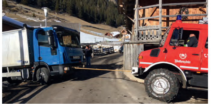
I destudafuech vën cherdei per d'uni sort de esigënza

cun vel meldefuech iel uni ann da fé cont, suvënz se tratel de situazions che n ie riesc boni de teni sota cuntriol