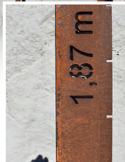
N detail che mostra su la mesura dla nëif