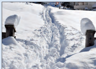
Tumeda dla nëif diagram nfurmatif