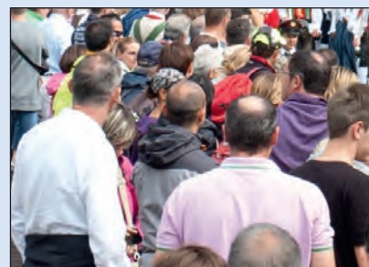
Jënt te Sëlva Statistica 2018