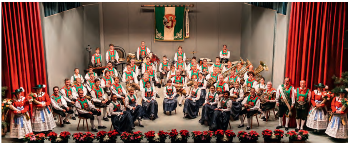
La Mujiga de Sëlva n ucajian dl cunzert de Santa Zezilia 2018.