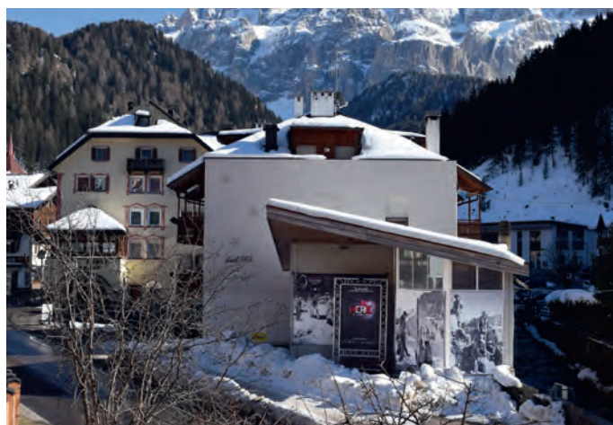
In zona "Ghetun" (ex distributore IP) verrà realizzato un padiglione rappresentativo ed informativo.

Come informazioni tattili contano le scritte in Braille, la scrittura in rilievo (sporgente o rientrante), strutture differenti nella pavimentazione, nonché linee d'orientamento tastabili e simboli in rilievo tastabili. Come infor-