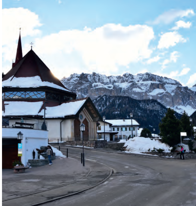
A Sëlva si intende valorizzare l'area della chiesa con un progetto di viabilità che interessa il tratto "Stadio-chiesa-strada Nives".

L'argomento principale della seduta del Consiglio comunale del 20 febbraio 2019 è stato la presentazione di uno studio per la riqualificazione urbanistica dell'area di viabilità stadio - chiesa - strada Nives . L'architetto Uli Weger di Bolzano ha spiegato il progetto che punta a valorizzare l'area della chiesa come punto di incontro e socializzazione nonché a collegare funzionalmente le strutture pubbliche adiacenti mediante percorsi e aree pedonali. Il progetto verrà sottoposto a formale approvazione nella prossima seduta e nel frattempo chiunque avrà la possibilità di sottoporre proposte migliorative. Il Consiglio ha poi approvato la prima modifica del documento unico di programmazione 2019-2021 (DUP) e la 1° variazione di bilancio di previsione al fine di avviare alcuni interventi urgenti. È stata poi riconosciuta la