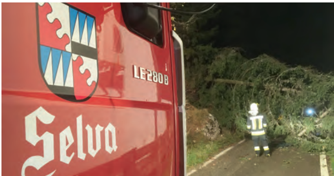
Ala fin de utober iel stat n gran vënt che à fat truep dann

Nce d'instà canche l fova de gran sdramoc cun truepa plueia fovel da jì a pumpé ora vel ciulè o garasc, schivé che vel ruf vede sèura i èures ora y datrai vëniel nce dant che n muessa jì a cri persones o vel tier, pona iel magari vel fulestier ntraupulà te n lift o d'otra situazions. Nce