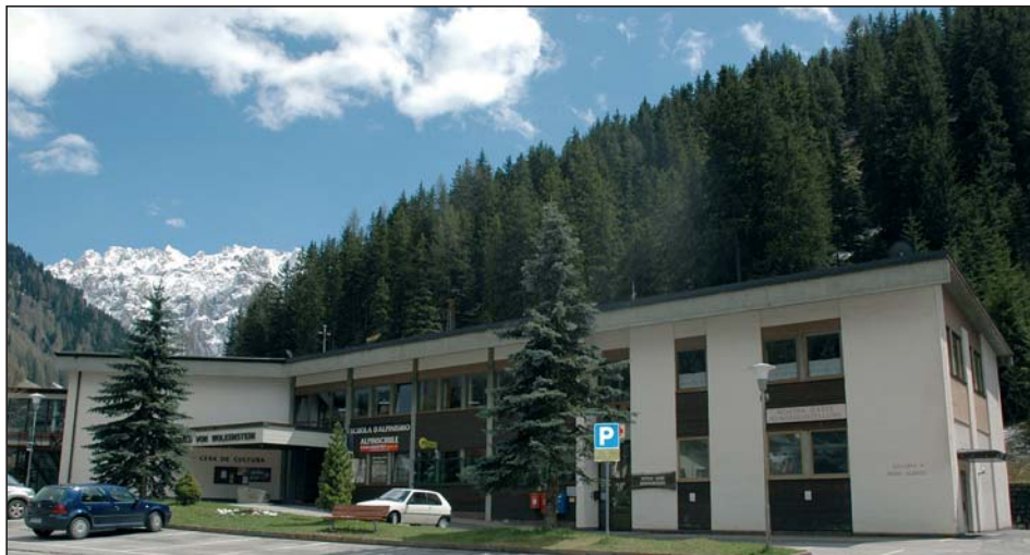
Per il risanamento della casa di cultura „Oswald von Wolkenstein“ (sala teatro) la Provincia ha stanziato un contributo di 100.000,00 Euro.

tributo provinciale di 100.000,00 Euro (L.P. 27/1975) per il risanamento della casa di cultura „Oswald von Wolkenstein“ (sala teatro).