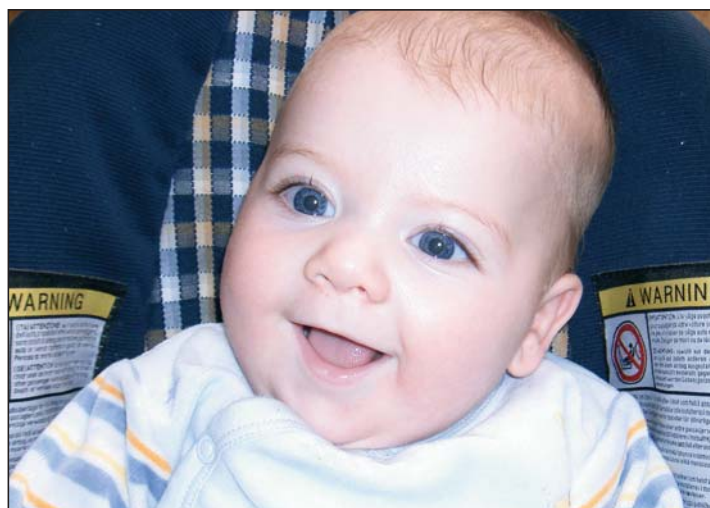
L pitl Leon ie nasciù ai 19 de luglio 2006