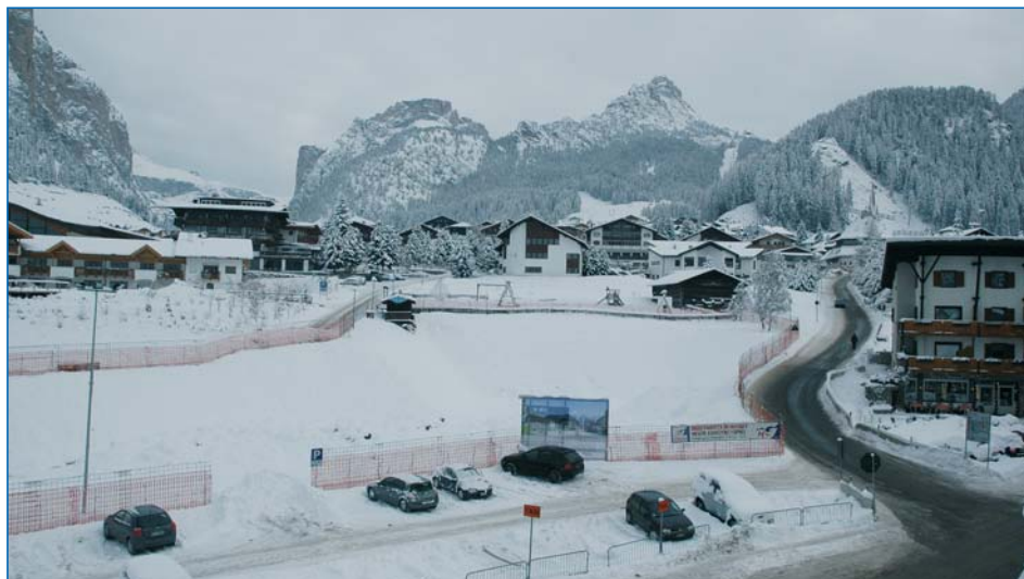
Su quest'area si realizzerà prossimamente il garage interrato Nives e la piazza sovrastante

Le tariffe del canone per i servizi relativi alla raccolta, l'allacciamento, la