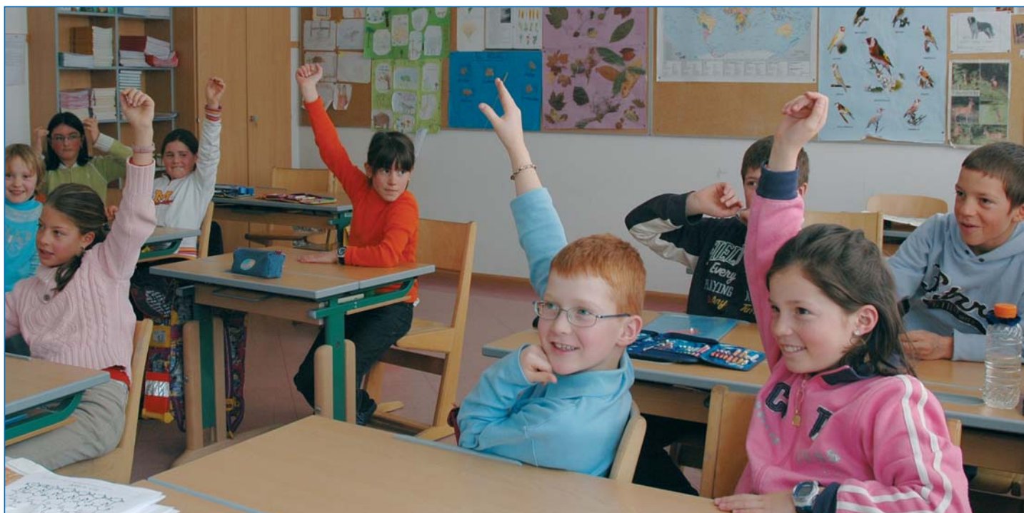
Schüler und Schülerinnen der vierten Klasse der Grundschule (4c)

Anbei finden Interessierte Hinweise zu den Einschreibungen von Schüler/innen in alle Schulstufen gegeben, nachdem der Beschluss zu den Einschreibungen vom 18.12.2006, Nr. 4700 neu gefasst wurde.