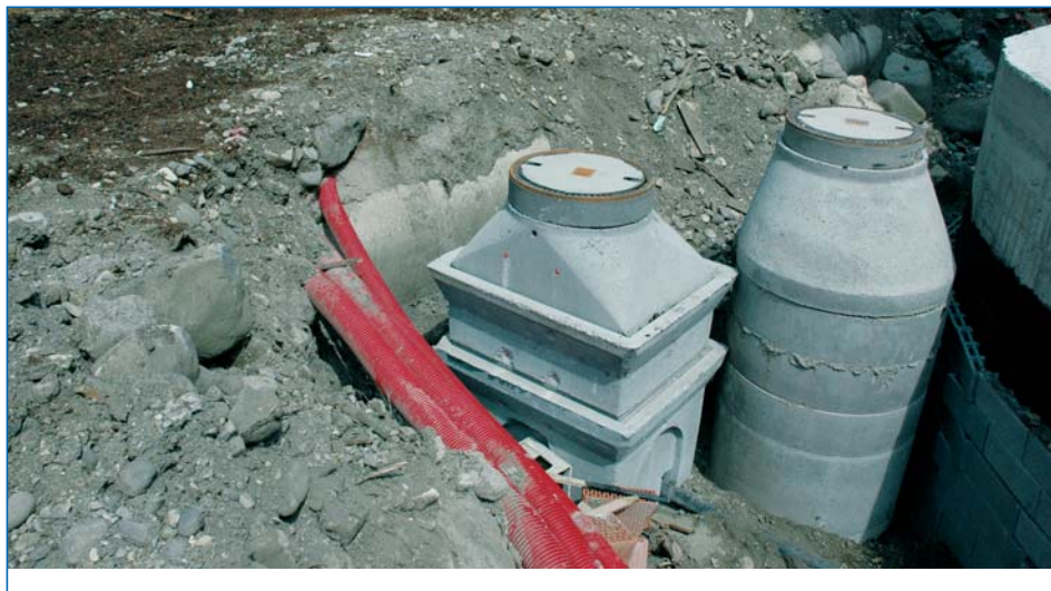
Le tariffe del canone per i servizi relativi alla raccolta, l'allacciamento, la depurazione e lo scarico delle acque di rifiuto sono state determinate dal 01.01.2007 in 0,90 Euro/mc. Per le seconde case a uso turistico la tariffa è maggiorata del 50%.

Sono stati approvati i rendiconti delle spese, provviste e servizi in economia eseguiti nell'anno 2006 dall'economista o dai funzionari responsabili.