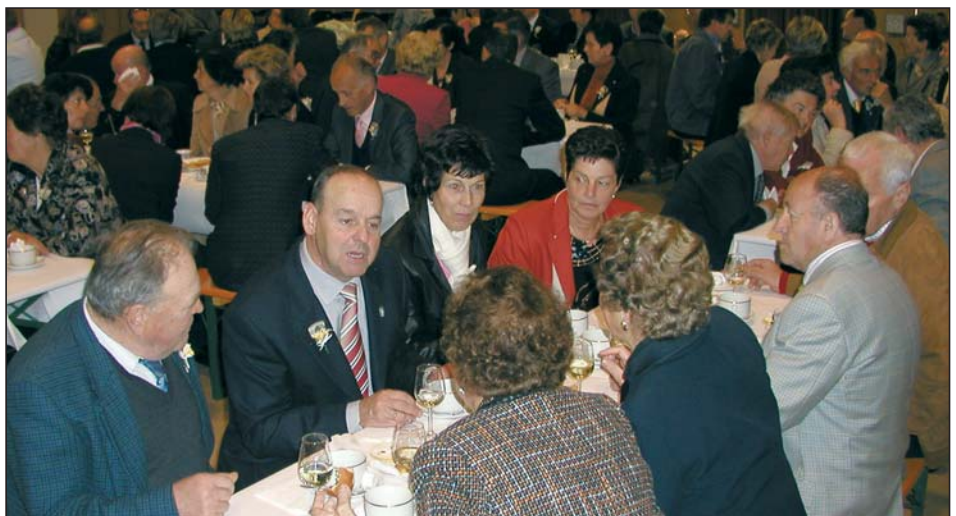
Ntan la festa te sala de Colonia