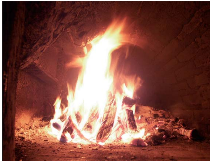
Eine Voraussetzung für eine gute Verbrennung ist das Heizen von trockenem und unbehandeltem Holz.

Das Fehlen einer künstlichen Luftzufuhr, einer aufwändigen Rauchgasreini-