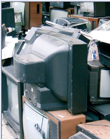
Televijions ne toca nia pra l refudam gros y muessa uni purtedes a Pontives

Chèsc refudam muessa unì purtà te n mplant de smaltimènt autorisà y ne unirà nia tèut pea n chèl di.