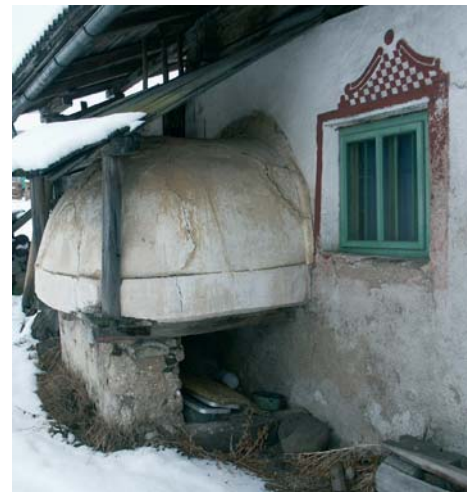
Na cronica dl luech de Sëlva ie de gran mpurtanza y de utl dantaldut per la generazions che vèn do. Sun la foto udons l' vedl fèur dal pan pra l' luech da peur de Larciunèi.

Eintritt ist frei. Erstmals singt der Chor ein komplettes Konzert vom mehr als zwanzig Stücken unter der Chorleitung von Massimo Zaccari. Das Repertoire besteht zur Hälfte aus neu einstudierten Liedern wie z.B. “And so it goes”, “Can’t help falling in love”, “Body and Soul” oder “Lean on me”. http://free-web.dnet.it/whitelily/index.html