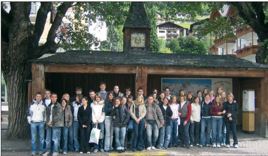
Studënc dl ITC de Urtijëi cun i studënc dl Ginase de Springe (D).

De merz de n auter ann saral pona i „nosc" - sculeies dl ITC de Sëlva, S. Cristina y Urtijëi - che puderà jì a Springe per l barat culturel.