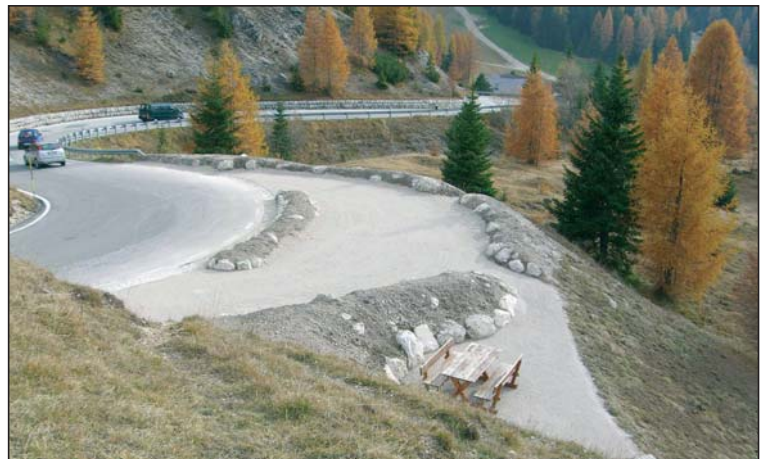
L ie bele unì metù man a fé de pitli lëures per abeli nce la stredes su per i jëufs; tan deplu sce la Dolomites unirà tëtutes ite tla UNESCO val debujèn de pitè nce n valgun posc' panoramics.

I lëures vën fac dala mpreja "Natur & Natur", che ie specialiseda te lëures de renaturazion de ambienc da mont.