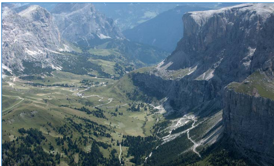
L jëuf de Frea da Saslonch ju

L Chemun de Sëlva uel rujené pea canche l se trata dl daz sun i jëufs. Oradechël ne iesen nia a una cun la provinzia de realisé nfrastutures per scudi, ma bën plu per na sort de vigneta.