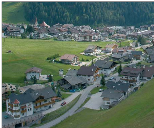
La strada Larciunëi - Val

Il parcheggio pubblico al Passo Gardena è stato modificato nel piano urbanistico comunale nel senso che la sua realizzazione e la sua gestione può essere affidata anche ai privati proprietari.