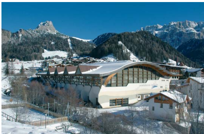
Lo stadio del ghiaccio "Panives" di Selva richiede interventi di sostituzione dell'impianto di ammoniacca

presentare nei termini domanda di contributo alla Provincia. Trattasi principalmente di interventi di sostituzione dell'impianto di ammoniacca che, causa segni inarrestabili di obsolescenza, necessita annualmente di sempre più costosi interventi di controllo e di manutenzione. Nel complesso i lavori previsti in progetto ammontano a ca. 1.080.000 Euro.