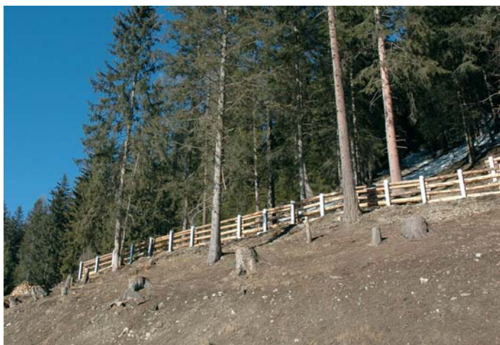
Interventi di protezione da caduta massi lungo la strada La Poza

Le tariffe del canone per i servizi relativi alla raccolta, l'allacciamento, la depura-