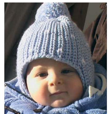
L pitl Hannes ie nasciū ai 17 de mei