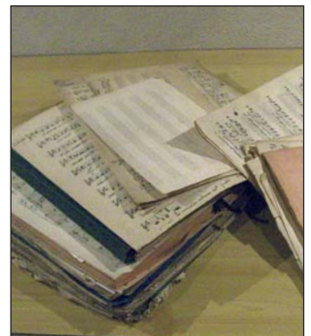
Das älteste Notenstück im Besitze der Singgemeinschaft Wolkenstein weist die Jahreszahl 1759 auf

Alle erhielten ein Diplom des Sängerbundes und einen Blumenstauß überreicht.