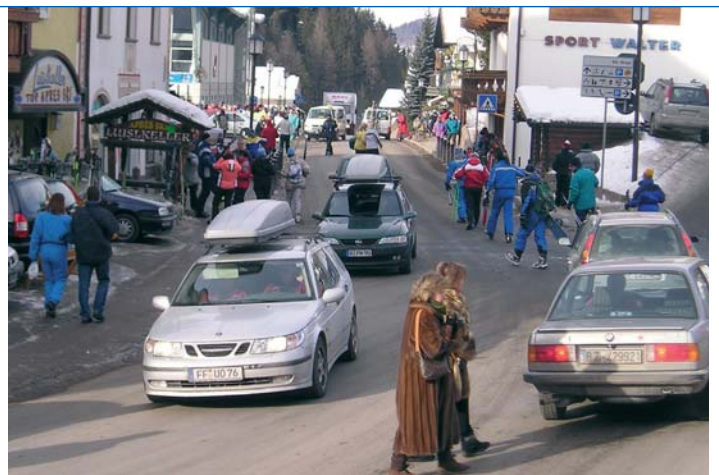
È stato istituito un senso unico nel tratto Hotel Europa - Strada Nives

Il senso unico istituito questi giorni sperimentalmente dalle ore 9.00 alle ore 17.00 nel tratto Hotel Europa – strada Nives, fa parte di questi tipi di intervento. Nelle