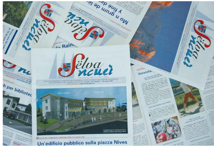
Da 10 ani ncā věniel bele dat ora la plata de chemun de SĚlva

L gran lěur fat dai dependěnc de chemun, n prima linea dal secreter de chemun Raimund Vinatzer,