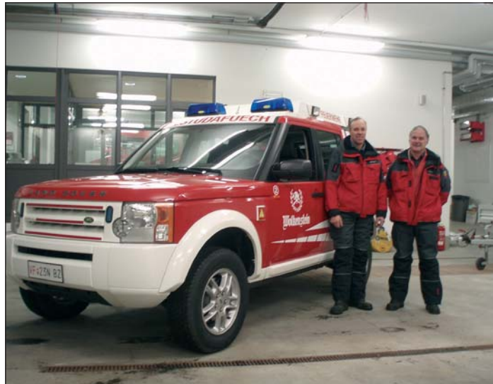
Cun l Land Rover Discovery posson mené 7 uemes y taché do n carèt cun na pumpa. L auto ie uni a custé 53.900 euro.

Trueps arà bele udù che tl Calènder 2008 iel mucia ite n pitl fal pra l mëns de setëmber. Nfati ne n'ie la segra nia ai 21 de setëmber ma bën n dumënia ai 28 de setëmber . Aldò dla regula toma la Segra de Sëlva for n la prima dumënia do San Matie che ie ai 21 de setëmber.