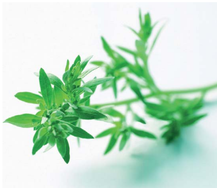
L té de scienz (Wermut) tuloven ite sce n ova brujé dant.

Ma per ti sté permez al frèit dl'inviern, che duc se ndebitova bel d'autonn ora, se dajoven dassènn ju cun ierbes de medejina , les tlupan y metan a secè via per l'instà per fé sòlbes y unghènc, per i avèi da tò ca n cajo de