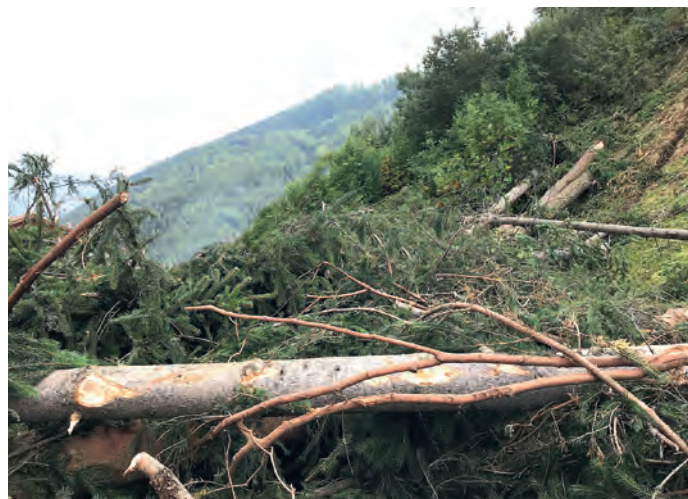
Il legname danneggiato in seguito agli eventi calamitosi dell'ottobre 2018 deve essere tagliato e rimosso.

L'Associazione Turistica di Selva di Val Gardena è stata incaricata formalmente della gestione del percorso sciistico "Stadio del ghiaccio - Schlosser" sulla base di un dettagliato studio di valutazione del rischio.