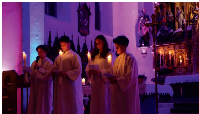
Jugendliche beim Sketch "Frieden, Glaube, Liebe, Hoffnung".