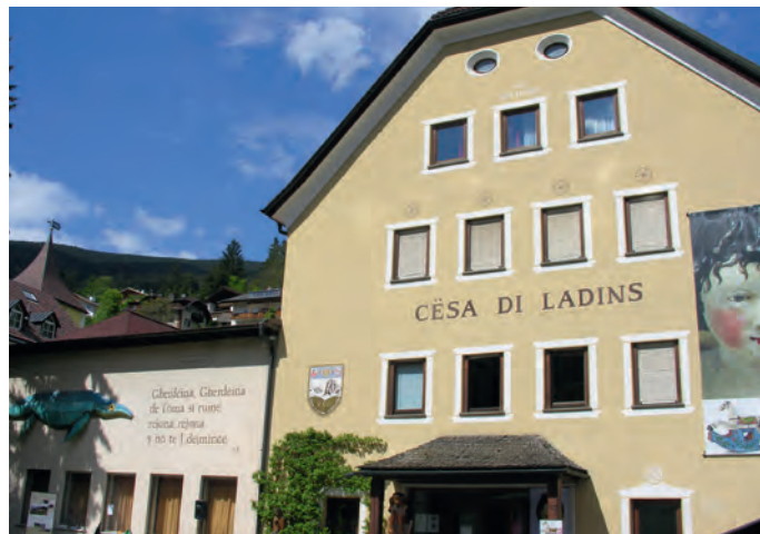
Per il risanamento e ampliamento della "Cësa di Ladins" ad Ortisei, quale sede del "Museum de Gherdëina" è stata approvata una delibera di massima di sostegno finanziario.