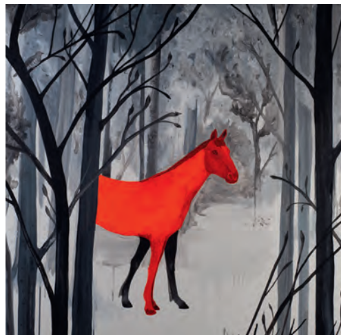
"Ciavei tl bosch", pitura de Federico Lanaro da udēi nchin ai 12 de jené 2020

Per fé a na maniera che l sibe plu sauri a mèter a ji l'atività se damanda la lia "Tublà da Nives" l sustēni da duta la populazion. Zitadines y i zitadins nteressei al'ert y ala cultura ie nviei a diventé cumēmbri giapàn nsci i nvic a duta la manifestazions y ala sentedes genereles, y ulache uniun à l dērt de vela y de unì lità te un di organns dla lia. L cuntribut per l ann 2020 ie restà unfat sciche i ani dant y ie de 15,00 euro y possa unì paià ite pra la Cassa Raiffeisen Gherdēina. L vën bele senti gra danora per n cuntribut.