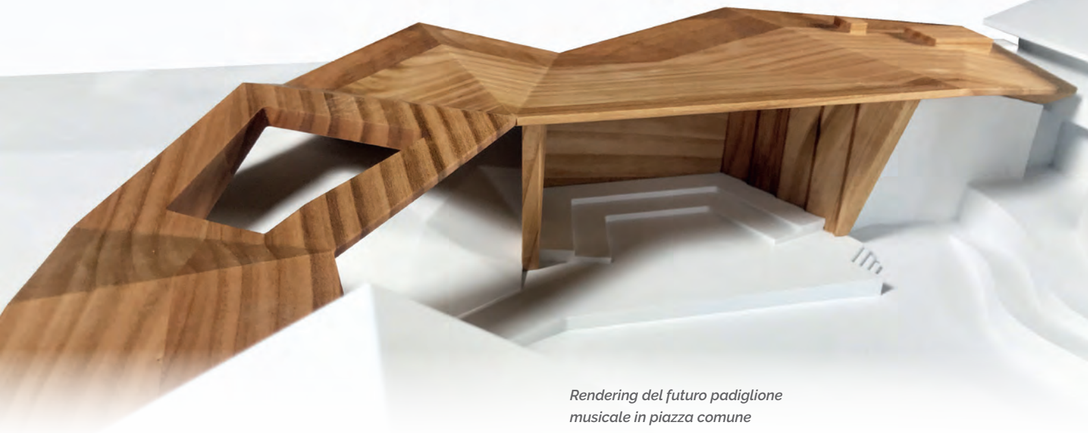
Rendering del futuro padiglione musicale in piazza comune

denti incongruenze tra il piano di attuazione della zona turistica approvato con delibera della Giunta provinciale n. 5090 del 18.11.1974 ed il vigente piano urbanistico comunale, al fine di dare certezza giuridica allo strumento di pianificazione.