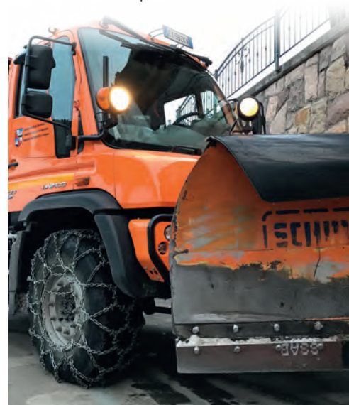
La cudria de chemun.

Sce l èssa da nevëi truep (sciche l ie suzedù ultimamënter de nuvëmber) pona ie la situazion plu ncompra da manejé per i lauranc de chemun y perchël se damanden mpue de pazienza da pert dla jënt. Oradechël dëssen nce ti dé la prezedënza canche n vëija che l ie na cudria che lëura pra na streda y fej manovres. Sciche for cialeran de fé dut chël che ie mesun, purempò saral vel streda o toch de streda che unirà permò palà canche la stredes mpurtantes de viabltà sarà paledes ora.