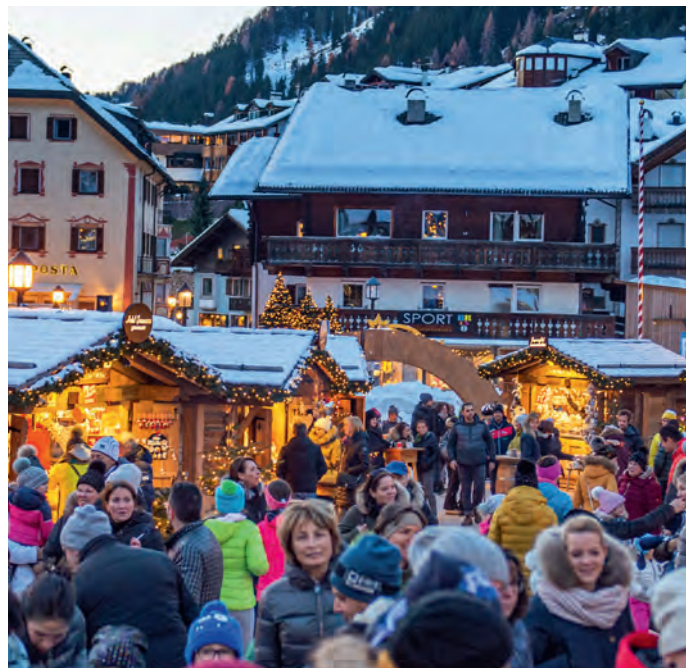
L "Marcia da Nadel" de Sëlva, chëst ann sun plaza Nives.

L ie bele passà cin ani da canche l fova uni metù a ji per l prim iede n Marcia da Nadel te Sëlva . La blota cïajotes su per la streda che cunliëia plaza Nives cun la dlieja sciche nce la furnadoia cun la cabines cuccenes fova riesc diventeda na atrazion, dantaldut per i seniëures. Chëst ann iel uni a s'l dé na mudazion logistica; davia che ntëur cësa de Chemun vëniel fat de majeri lëures ne fossa chësta situazion nia stata massa na bela paladina per l marcià y ëssa dessegur nce disturbà l ambient da Nadel. Nscila àn cuncià su la hities sun plaza Nives y tlo se tol ora dut cant drët bel dajan ca na atmosfera particulera. Passan dlongia la diesc cïajotes de lën via tofen l vin cuet y n vëija d'uni sort de guljaries tipiches dl tëmp d'Avënt y de Nadel, tëurtes y ciculates fates n cësa, ma nce de bon apertifs, nsciuna truep prudoc che nveia a se fermé, cialé, ciaculé y s'la lascé ji bona. Drët carateristiche ie nce l program de manifestazions che vën pità y tlo possen daniëura audi cianties purtedes dant da ciantarins y sunadëures de Gherdëina y che a chësta maniera nveia a senti mo deplù l Nadel. L marcià resta daviert nchin Santaguania, ai 6 de jené 2020, uni di domesdi dala 15:00 nchin ala 19:00.