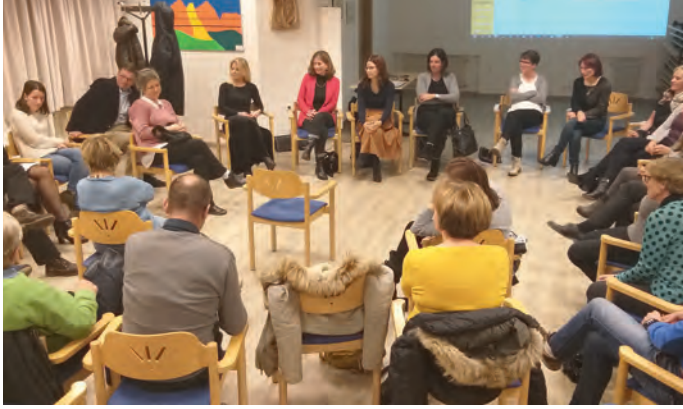
Die Arbeitsgruppe hat konkrete Vorschläge unterbreitet.