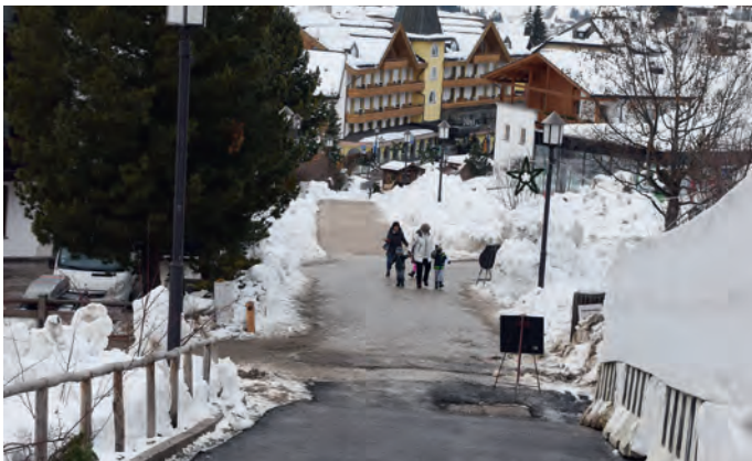
La streda da ji a pe vën inò sciaudeda.

funzionela che dëssa nce uni nuzeda sciche mensa dla scola elementera. Tl partimënt dessot uniral dat lerch a na cësadafuech che sarà de utl te deplù ucajions, n iede per anjeniè ca la spëisa di sculeies ma pona nce per la lies canche l ie vel festa sun plaza de chemun. L ti vën metù a cuer a duc i zitadins che sun la plaza sëura scolina y sota dlieja vel la regula dl " disco orario " y che n dëssa nce se teni a chësc.