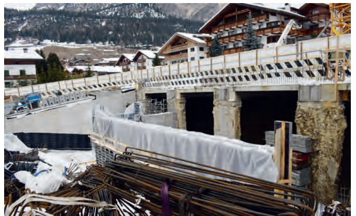
Na pert dl garasc sota tiera; tlo sëuravia uniral a s'l dé la plaza de chemun nueva cun l bel podium.

Mo dan che scumènçe la sajón da d'inviern àn per ntant stlut ju i lëures ntëur plaza y garasc de chemun. Chisc dis passei àn nce tëtut ju la gran gru y rumà via dut ciche l se lasciova y stlut l cantier . A chësta maniera iel inò mesun passé cun l auto dal Ghetun su de viers de dlieja y inant ite per la streda Nives o streda Puez. L toch de streda sota dlieja, iló ulache n à giavà sotite per fé n garasc privat, sciche nce l toch sëura scolina ie unida asfalteda provisoriamënter y n à nce anjenià ca la plazes da lascé i auti. Al mumënt saral da garat deplù lueges per lascé i auti , nce sota plaza de dlieja. Mpià ie inò uni l sciaudamënt pra la streda da ji a pe danter plaza Nives y dlieja y nscila sarà l fonz inò liede da nëif y dlacia; chësta ie na gran sauridanza y porta prò che n possa ji segures a pe. De tei pitli stroc vëniel mo fat te cësa de chemun ulache n ie tl lëur de anjeniè ca na sala pluri-