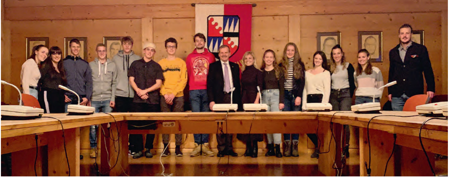
Jèuni y jèunes de 18 ani se à ancuntà te Chemun per la festa dla majera età.