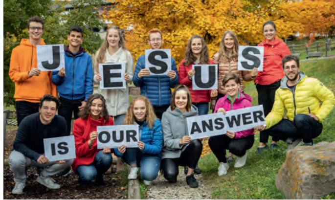
La grupa de jëuni che à metù adum l' calènder nuef.