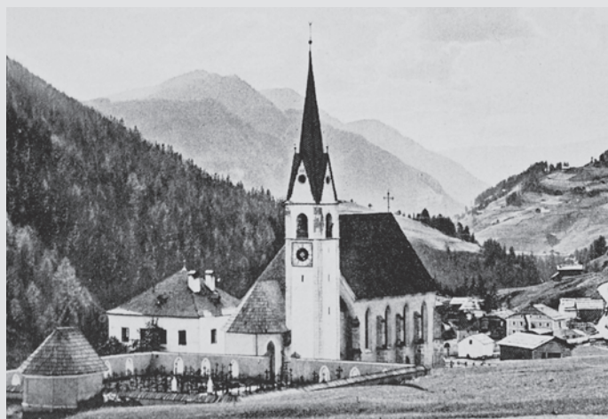
Die Kirche von Wolkenstein; Fotografie aus dem Jahre 1893

Am 18. Juli 1887 5 ½ Uhr Abends schlug der Blitz in unserer Kirche ein. Durch das Dach auf der Vorderfronte fahrend, drang er in gerader Richtung durch die zum Aufziehen der Orgel am Gewölbe angebrachte Öffnung herab zur Orgel, welche er gewaltig erschütterte, stellenweise aufriß u. Stücke davon bis zum Presbiterium hinschleuderte. Vom Chor fort, der übrigens nur unbedeutende Verletzungen erlitt, fuhr der Blitz herab zum Hauptportal, wo er ein kleines Loch in der Hauptmauer aufriß u. durch dieselbe in die Erde drang. Der angerichtete Schaden, Gott Dank, war nur an der Orgel von Belang, u. ist nicht genug zu verwundern, daß gerade in diesem Momente kein Mensch in der Kirche war, da doch sonst u. besonders in Summerszeit