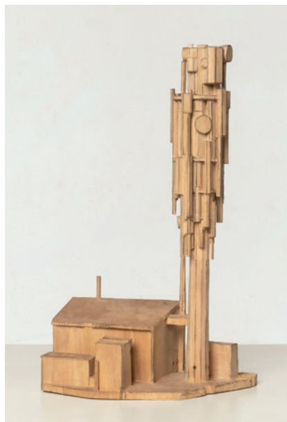
"Sender", n lëur de Martin Kargruber

tla dinamiche dla sëuravivenza, dl' cunlauré y ti prozesc a tò dezijions. Cun lëures realisei cun duc i mediums dl'ert visuela dëssa la dinamiche y la funzions de chèsc fenomen unides ejaminedes y unì dac stlarimènc sun cie che ie l' scumeniamènt de cërta reazions empatiche y coche chèsc cumpurtamènt se liëia cun nosta comunità. La giarida dla mostra sarà ai 19 de utober.