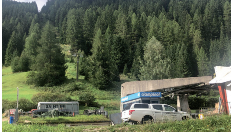
Per la zona "Isgla impianto Ciampinoi" è stata approvata la proposta di piano di attuazione

È approvato il contratto di concessione in uso di terreno comunale alla ditta Demaclenko IT s.r.l per l'occupazione delle p.f. 814/12, 814/5 e 815/38 con 250 ml di condutture elettriche e di acquedotto interrato, accesso a piedi e con autoveicolo alle botole d'ispezione, e deposito e messa in funzione, nei mesi da ottobre a marzo, di un impianto per la produzione di neve artificiale.