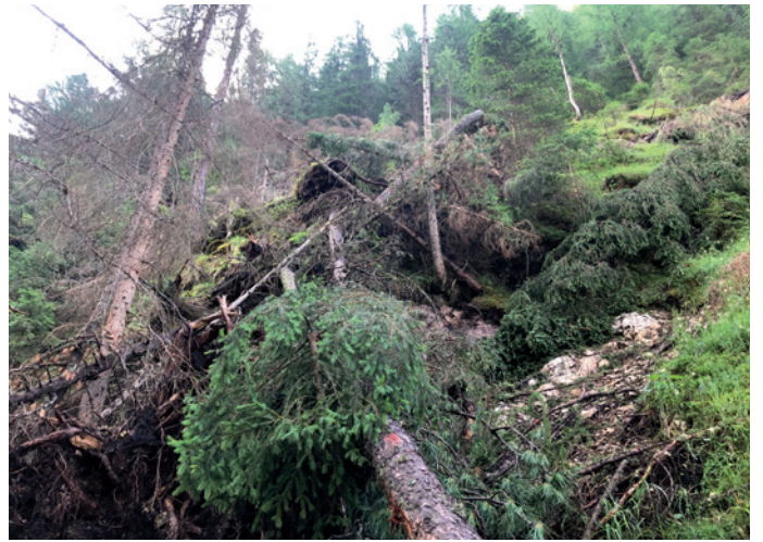
Te Val: lëns sturcei do l gran vënt dí 18 de lugio 2023

Ntan l mëns de lugio de chëst ann messoven bele n valgun iedesc sté cun trica, davia che l se ova arlevà n gran vënt, che à drusà deplù lëns. Nfati, da Val ite, dan-