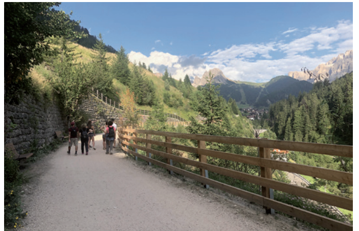
L troi dla ferata ie uni slargià, nsci che l ie plu lerch per chèi che va a pe y per chèi dala roda.

Te n valguna lueges iel uni fat na sort de plaza da se fermé, per se goder la bela ududa panoramica, sibe itevier che nce oravier. Sun dut l troi iel uni metù ite trueb banc y sentà pitli lèns, sienes y plantes. Sambèn che ntant ie mo dut scialdi ros y n muessa avèi mpue de paziènza nchin che l crèsce ite; n auter ann puderan se goder l troi dla ferata mo deplù.