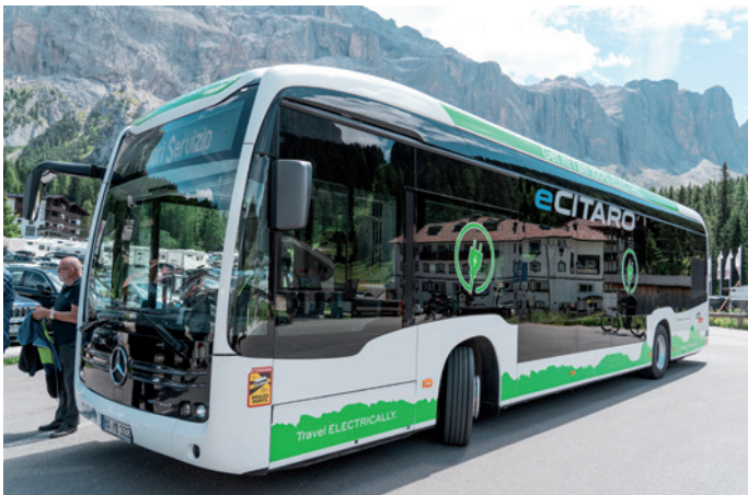
Dieser Elektrobuss fuhr im August emissionsfrei auf Grödens Straßen.

Bei diesem Pilotprojekt handelte es sich um den Einsatz von zwei unterschiedlich großen E-Bussen: einen 12-Meter E-Bus mit einer Förderkapazität von ca. 75 Personen sowie einen 18-Meter E-Bus mit Platz für ca. 150 Personen. Die für diese Testphase kostenlos von Daimler Buses Italia zur Verfügung gestellten Busse werden mit sieben Batterien insgesamt 441 kWh betrieben.