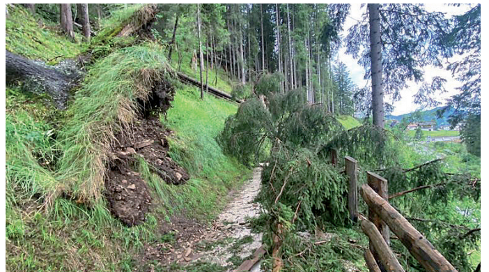
Sun l troi che mëina ora La Sëlva iel ënghe tumà ca lëns

taldut a man drëta dl vedl "Schiesstand" su, tumova ca chi lëns sciche tei fulimanc, na cossa mo mei dré ududa te Sëlva. Lëns drusei iel nce stat sun Costabella, sun Risaccia y ora La Sëlva.