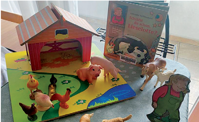
I libri ie unic presentei cun gran fantajia y creatività

I mutons y la mutans à daldò pudù se tò pea mo vel liber da cialé ntan l'ena tla "Cësa di pitli".