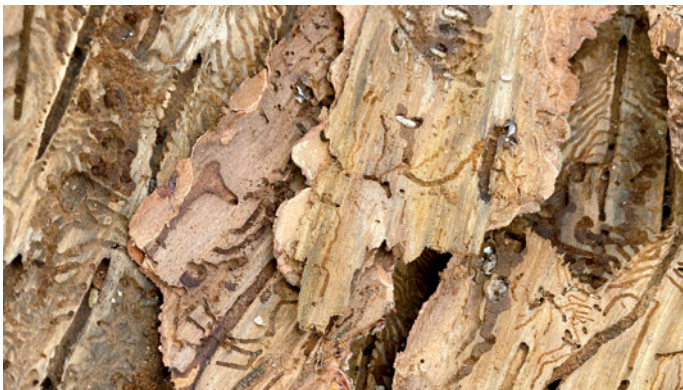
N toch de scorza ulache n vëija i canai che l chëifer geva ora per mèter ite i ueves. Sun la fotografia recunèschen larves blancs che madurèsc te 7-12 enes per diventé pona n chëifer.

L chëifer dala scorza ( Borkenkäfer/bostrico ), ie n pitl nset parassit, che se ntana ite sota la scorza dantaldut di pèces y che ti tol duta la forza al lèn l purtan tan inant che l sècia. Cun l gran vënt dla tampesta „Vaia“, stat dai 26 de utober nchin ai 5 de nuvèmber dl 2018 mpue te dut l raion Elpes-Adria y che à nce tucà gran sperses de bosch te nosc raions, fovel cun duc i lëns tumei oradenia cundiziions ideeles per l chëifer per se sparpaniè ora. L ann do pona, tl inviern 2019/2020 ie stata la truepa nëif, che à inò sturcià truepiscimi lëns y l ciaut che ie stat l'ann passà ti à mo n iede dat na bela sburdla ala procreazion dl chëifer. L chëifer dala scorza à na grandèza de n 4-5 mm de culèur ros cun eles che jola, judà nce dal vënt, nchin a 3 kilometri. Aldò dl sëurastant dla Forestela de Gherdëina Marco Planker iel i lëns ndeblii che dà ora n tof che i chëiferi sënt, n seniel che ti dij che i possa se ntané ite drët sauri sot ala scorza. Defati, ie l chëifer bon de ji tres de pitli bujes o sfëntes ite y se giavé ora na „Rammelkammer“ coche n dij, l nset dà ora si feromons che cherda adalerch la baibl y chësta geva pona ora canai per lascé sèura i ueves fecondei. L vën