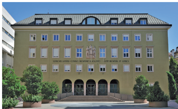
Der Sitz des Südtiroler Landtags in Bozen

Unter https://landtagswahlen.provinz.bz.it findet man das neue Wahlportal in vier Sprachen. In dieses Portal fließen alle wichtigen Informationen über und zu den Landtagswahlen ein. Es finden sich dort Informationen für Wählerinnen und Wähler, für Parteien, für Kandidatinnen und Kandidaten sowie für die Gemeinden. Zusätzlich zu den wichtigsten Informationen zu Wahlmodus und Wahlmöglichkeiten finden sich auch die häufig gestellten Fragen in einem FAQ-Fenster. Über dieses können Bürgerinnen und Bürger mit der Verwaltung interagieren und Antworten auf neue Fragen erhalten.