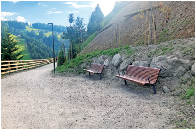
Se fermé per se goder l bel panurama. Ucajions n iel assé...

L "Troj dla Ferata" nvièia inò a jì a spaz, do che l ie uni fat deplù lèures de ressanamènt y che ti à dat n mièur cialé ora. L proiet udova dant na revalutazion de chèsc troi storich danter Larjac y Maciaconi cun n valgun ntervènc de mpurtanza per fé a na maniera che l troi sibe plu segur, ma nce plu adatà ala esigènzes dal didancuei. Ntan la prima fasa de lèur iel uni segurà l rone, nscila che n possa jì ite y ora zènza avèi tèma de vel puron che burdlea ju sun troi. La burta sief de fier sun l mur de peton, che fova unida fata su dan n valguna ani per fermé i sasc, ie unida tèuta demez, davia che tres n sistem nuef de segurèza, na gran rè fermeda cun pontes de peton tl