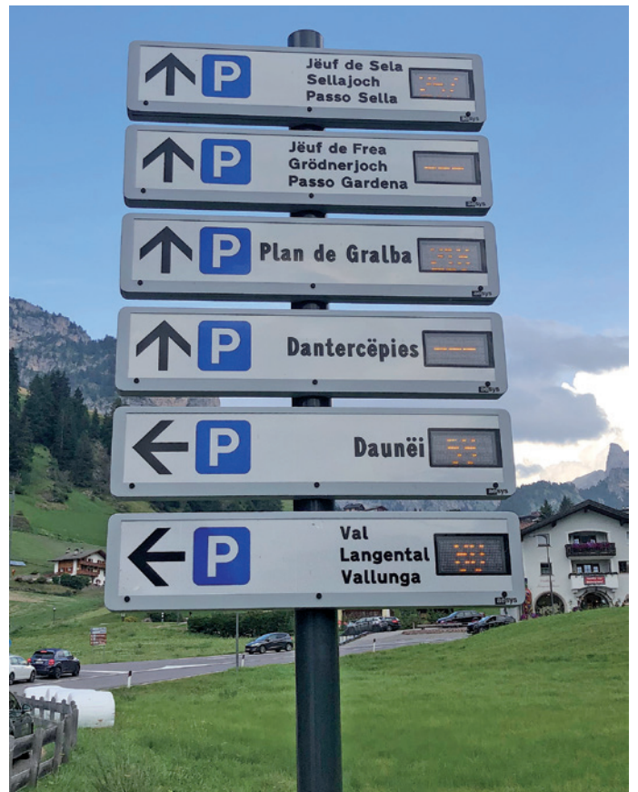
Anhand dieser Anzeigetafel wird man über die Verfügbarkeit der freien Parkplätze in Wolkenstein informiert