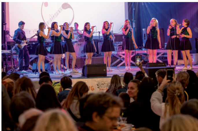
I "Hosianna" à fat na bela performance

Chiche ulèssa cumpré la CD "Figo Hits" possa ji tla bibliotech dla Cèsa di Ladins a Urtijèi (priesc 12,00 €).