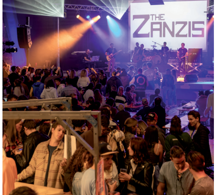
Do giut inò sun palch... la grupa "The Zanzis"

Da nuef fovel chèst iede che ntan la sèira iel uni prejentà na CD cun mujiga moderna ladina dal titul "Figo Hits" . Sun chèsta compilation , data ora dala Union di Ladins de Gherdëina sun scumenciadiva dla grupa de lèur "LadinVif", iel da abiné 14 cianties de bands de Gherdëi-