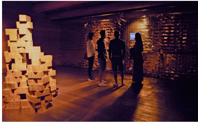
Ziedli d'or. Ududa dla mostra de Fabrizio Senoner "Biz"