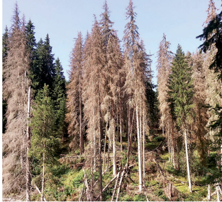
Lëns tuhei dal chëifer dla scorza

sciazà che da un n chëifer possel garaté plu de 100.000 descendënc, pona possen bën se nmaginé tan debota che na tel popolazion de chëifri se svilupea inant y tan rie che l ie a i fermé. I lëns sèc che n vëija danter i pèces vèrc ie bele morc defin y vel un dij che l fossa bon i taiè ora y mo na rissa o deplù ntèurvia, d'autri miena che i tulan ora muda la cundiziions che ie ntèurvia y che chëi lëns se ndeblesc trajan inò adalerch l chëifer. Ntant iel na fortuna che gran pert di bosc te Sëlva ie sun grunt chemunel y la Chemun stanzaia uni ann truep scioldi per taiè, scurzé y mené demez l leniam „nfetà“.