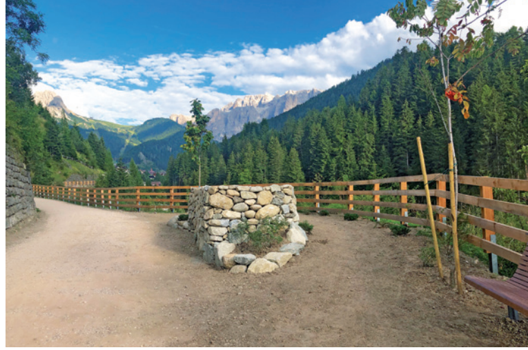
Sun l troi iel uni fat deplù lèures de ressanamènt y slargiamènt

rone, an aldidancuei na forma manco nvasiva, dantaldut per l uedl. L fova pona udù dant de slargé dut l troi nchin a n mascim de trèi metri; chèsc fova debujèn, davia che l ie for plu y plu persones che se nuza de chèsc y dantaldut nce chèi dala rodes.