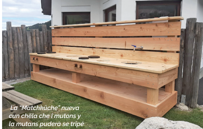
La "Matchküche" nueva cun chëla che i mutons y la mutans puderà se tripé

Tres la "outdoor education" , fej i mutons y la mutans