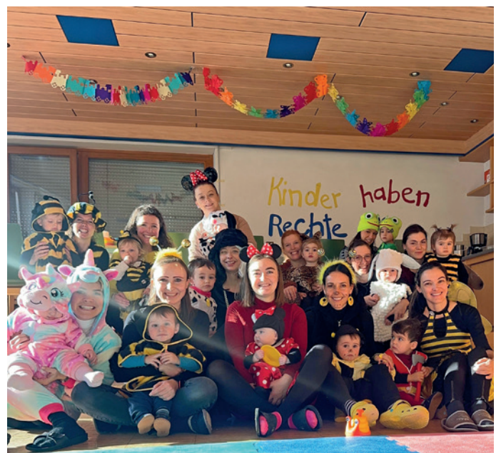
I pitli cun si mams, duc sambèn n mascra pra la festa da Carnescià

Coche da tradizion àn nce chëst ann metù a ji la festa da Carnescià per i fantulins dl luech y de chësc se à inò cruzià la grupa dl "Pinocchio" de Sëlva. La grupa nvieia uni mierculdi te Colonia basite (danter la 9.30 y la 11.00), ulache la umans possa se ancunté cun si pitli fajan damat, se buan n café; chëst iede ne pudova sambèn nia mancè n bon crafon da sulza. Na gran cumpèida de tieres sciche eves y surices ie ruvedes ala festa, ma da spiè fovel nce na biescia, n giap, n unicorn, n crot y n valgun cians. Duc y dutes se à drèt deverti fajan nce vel' pitla matada da Carnescià. Ala fin ne pudova nia mancè la fotografia de grupa drèt da culèur.