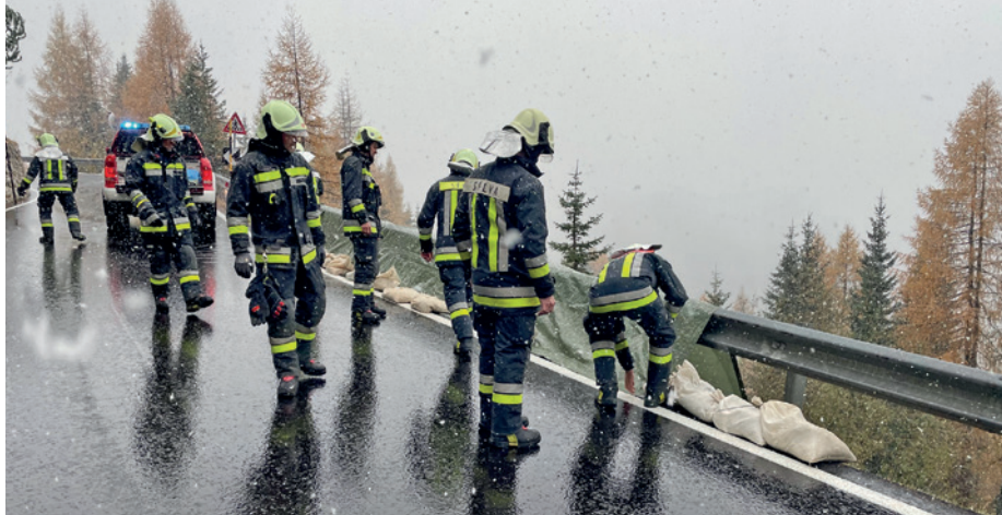
Bei jedem Wetter im Einsatz: unsere Feuerwehrleute.

Im Januar wurde auf einen Brandalarm in einem Hotel mit Rauchentwicklung reagiert, und man brachte die Situation rechtzeitig unter Kontrolle. Außerdem bewältigte man einen Einsatz nach einem Lawinenabgang im "Chedul-Tal", bei dem eine Person verschüttet wurde. Die Person konnte geborgen werden, jedoch verstarb sie einige Tage später.