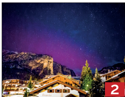
Cronica 2023 Cie iel pa tan suzedù l'ann passà?