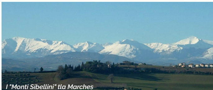
I "Monti Sibillini" tla Marches