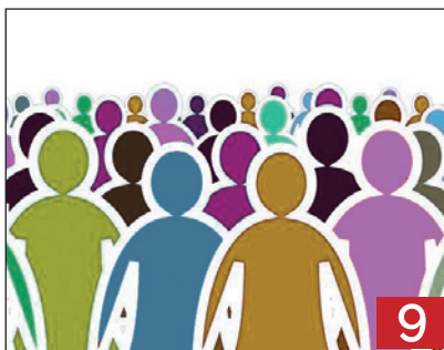
Muvimènt demografich La popolazion cala inò