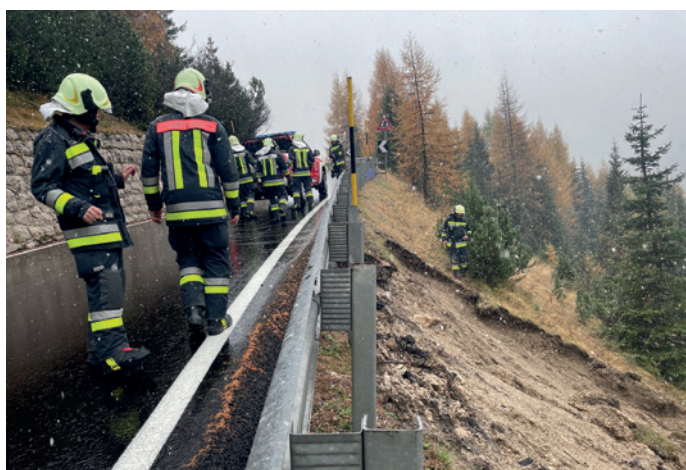
Murenabgang am Sellajoch

Im August hatte man drei Brandeinsätze, darunter einen Fehlalarm in der Mittelschule Wolkenstein, die erfolgreiche Kontrolle eines Busbrandes am Grödner Joch und die Unterstützung bei einem Einsatz mit zwei