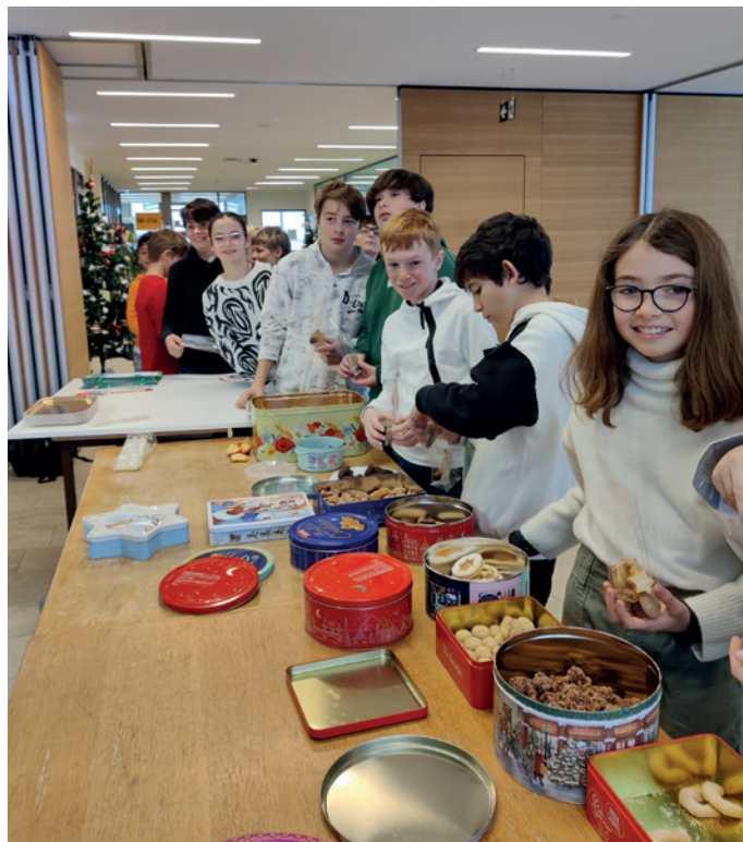
Sondles da Nadel... cie gola!

metuda" perfeta dl retlam. Tl cheder dl workshop ti iel uni spiegà ai sculeies coche cèla ora la ciadèina produtiva dla ciculata y la desvalivanza tl sparti su l davani. Tl medemo mumènt iel uni auzà ora la mpurtanza dla urganizacions che sustèn n cumerz "rèidl". Chèstes garantèsc cundizions de lèur denitèuses per i cultivadèures dla plantajons de cacau, acioche i posse viver bèn, zènza uni nuzei y si mutons posse ji a scola zènza uni sfrutei coche forzes de lèur.