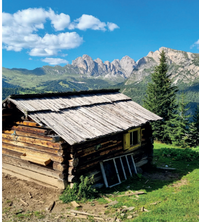
La baita "Cason" nella località Sëurafrëina verrà ricostruita

È approvato il piano esecutivo di gestione , redatto in termini di competenza per il triennio 2024-2025 e in termini di cassa per l'anno 2024, in coerenza con il bilancio di previsione ed il documento unico di programmazione.